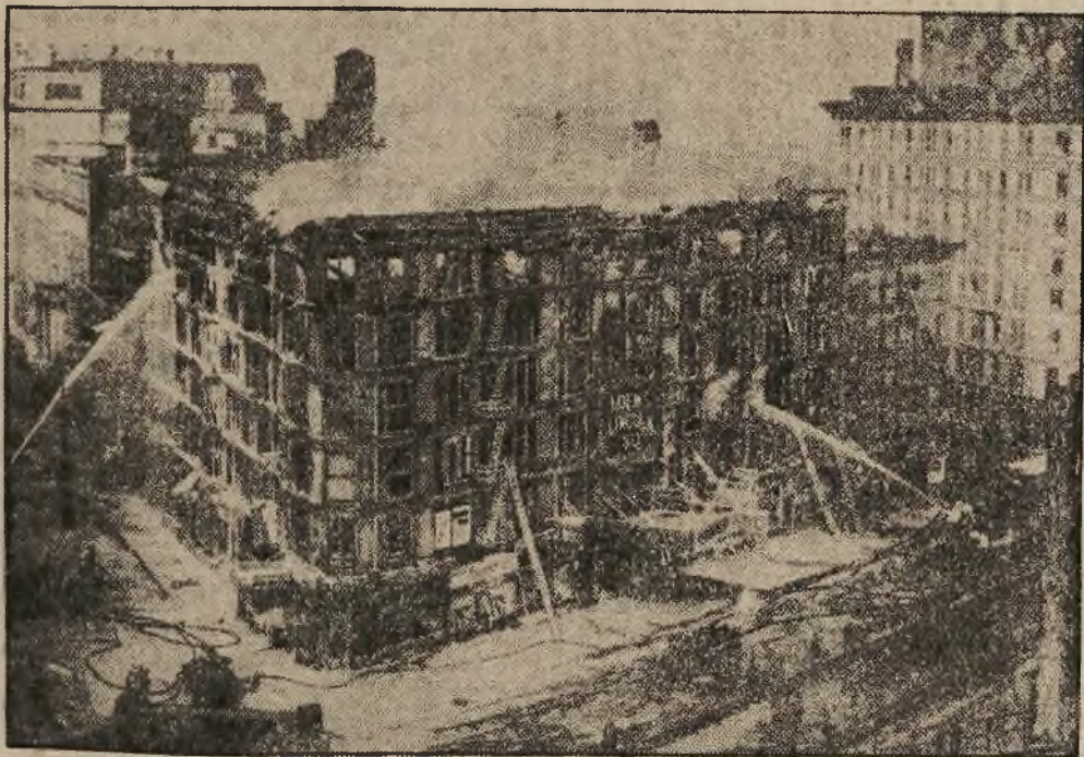
Großer Kinobrand in U. S. A.

Paris. In Thumesnil wurde am Montag eine Großweberei von einem Feuer vollkommen zerstört. Das Feuer breitete sich mit ungeheurer Geschwindigkeit auf sämtliche Abteilungen der Weberei aus und hatte gegen Nachmittag einen Umfang angenommen, der das Eingreifen des größten Teiles der Pariser Feuerwehr notwendig machte. Erst als sämtliche Gebäude buchstäblich unter Wasser gesetzt worden waren, gelang es, den Brand zu löschen, der in den riesigen Vorräten von Baumwolle und Wolle immer wieder neue Nahrung fand. Der Sachschaden beläuft sich auf über 2 Millionen Francs.