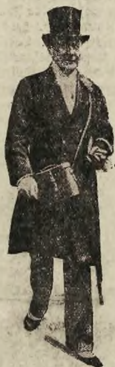
Der arme Lord

London. In einer Unterredung mit einem Vertreter des „Daily Herald“ äußerte sich Finanzminister Snowden über die Finanzlage Englands und warnte vor allen Dingen vor einer Panik, für die trotz aller alarmierenden Nachrichten kein Grund vorhanden sei. England habe schon andere schwere Zeiten überstanden und werde auch diese Krise überstehen. Zudem sei die gegenwärtige Lage außerordentlich ernst und erfordere entsprechende Maßnahmen. Diese würden dringlich sein. Er hoffe aber, daß sie jeder willig tragen werde, wenn sie gerecht auf die einzelnen Bevölkerungsschichten verteilt würden. Der Notzustand sei nur vorübergehend. Snowden legte besonderen