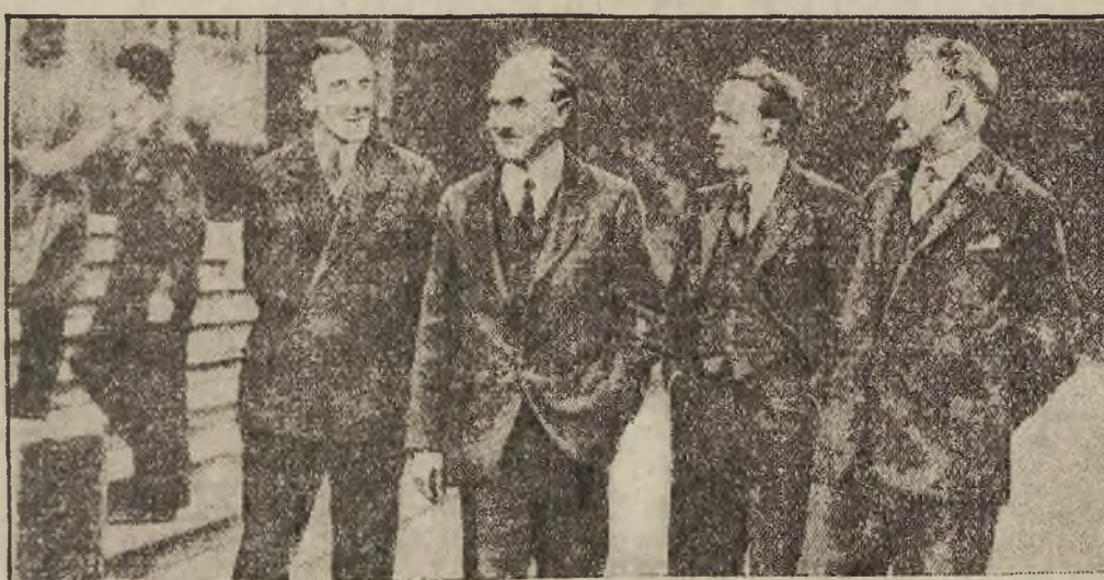
Die „schnellsten“ Männer der Welt

Madrid. In Granada wurde am Montag von den Revolutionären der Generalaufstand ausgerufen. Polizei und Militär haben umfangreiche Vorsichtsmaßnahmen getroffen und u. a. die wichtigsten Punkte der Stadt und sogar die Häuser ihrer Umgebung besetzt. Bisher ist es zu keinen blutigen Zusammenstößen gekommen.