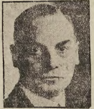
Der neue Leiter des preussischen Volksschulwesens?

Berlin. In dem Schreiben, in dem der preussische Finanzminister Höpfer-Wschoff dem preussischen Ministerpräsidenten Braun am Montag spät abends seinen Rücktrittsentwurf mitteilt, heißt es u. a.: „Der Verlauf der heutigen Sitzung des interfraktionellen Ausschusses der preussischen Koalitionsparteien hat mich davon überzeugt, daß ich auf die für meine Amtsführung erforderliche Unterstützung der Regierungsparteien nicht mehr in ausreichendem Maße rechnen kann. Der Verlauf der heutigen Staatsministeritzung hat mir jedoch gezeigt, daß auch zwischen den übrigen Herren Staatsministern und mir die erforderliche Einmütigkeit nicht mehr besteht. Außerdem ist es mir nicht gelungen, diejenige Übereinstimmung zwischen Maßnahmen der Reichsregierung und der preussischen Staatsregierung herbeizuführen, die in der heutigen Zeit notwendig wäre. Da es mir unter solchen Umständen nicht möglich ist, mein Amt erfolgreich weiter zu verwalten, trete ich gemäß Art. 59 der preuß. Verfassung von meinem Amt zurück.“