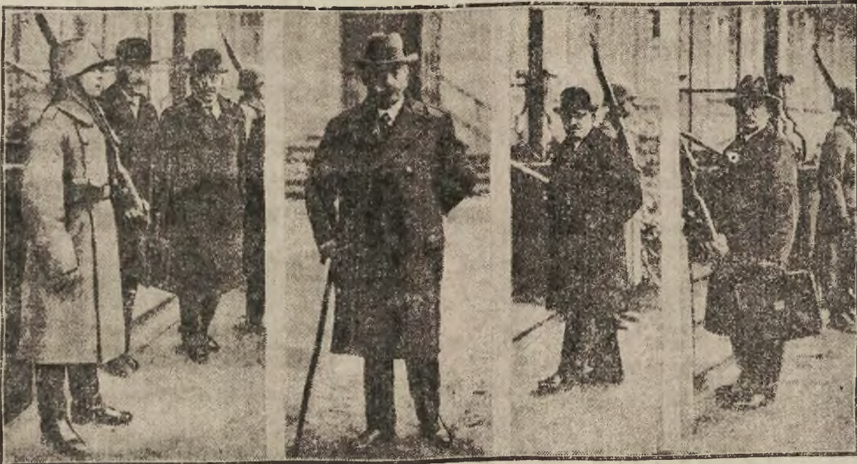
Die Eröffnungssitzung des Wirtschaftsbeirats

Damit endete der fünfte Verhandlungstag.