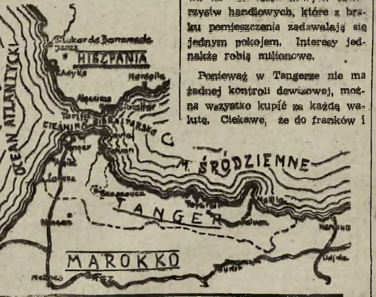
Mapa przedstawia lokalizację Tangeru w Maroku, przy granicy z Algierią.