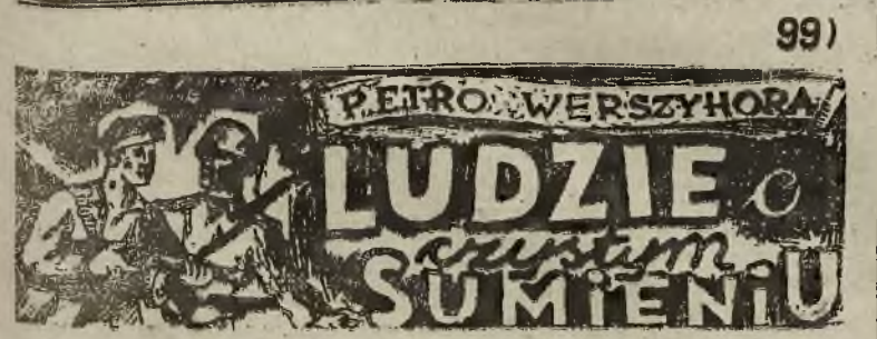
przełożył: Leopold Lewin

ny i to w wielkich ilościach. Nowo odkryty gaz stanowi t. zw. „górną łuskę”, pod którą znajdują się właściwe pokłady. Gaz będzie eksploatowany po odpowiednim zabezpieczeniu górnej warstwy, z chwilą gdy wiercenia osiągną najbogatsze złoża.