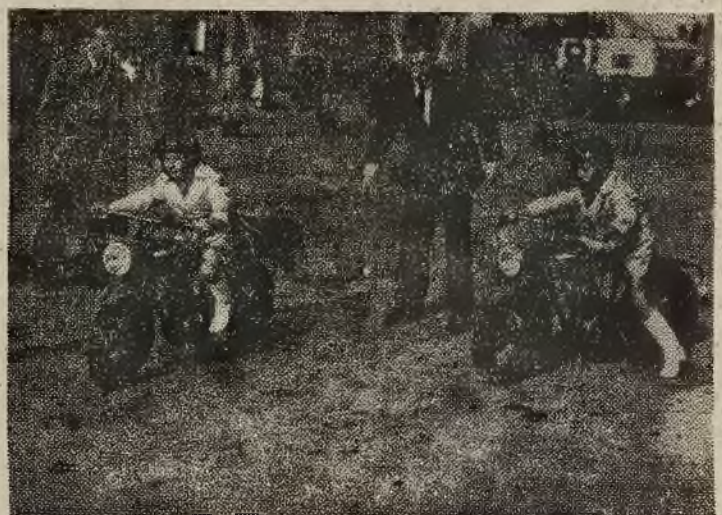
FRANCJA. O wartości nie świadczy jedynie lata. Zdjęcie jest tego najlepszym dowodem. Dwóch młodych francuskich chłopców startuje, z zacięciem, którego mogliby imponować starsi, na zawodach motocyklowych.