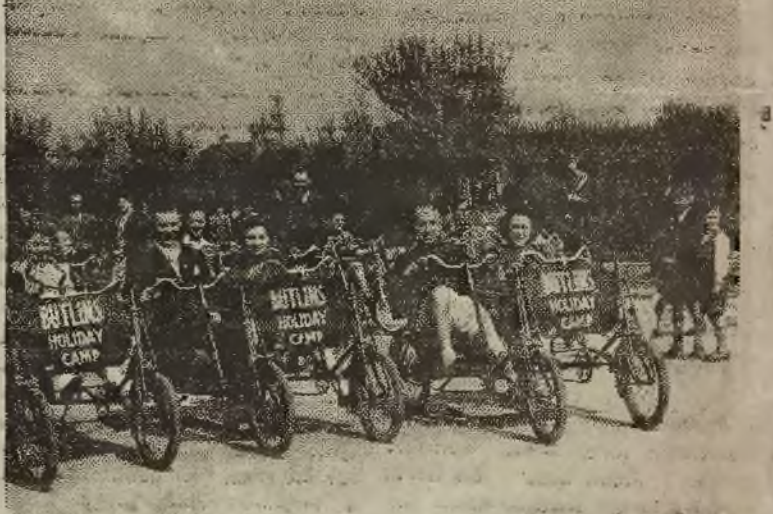
ANGLIA. - Clacton. - W Bullins, miejscowości wyprodukcyjnej, młodzi i starsi uprawiają sport kolarski. Na tych rodzinnych rowerach nie ma obawy jakiegokolwiek katastrofy.