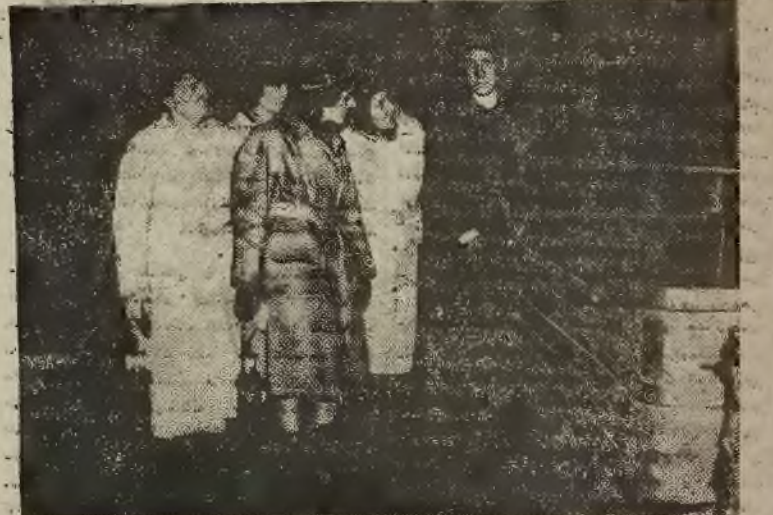
ANGLIA. Angielki, aby zapuścić kryzysowi węgielom, dobrowolnie zgłaszały się do pracy w kopalni (Aschington Pitt).