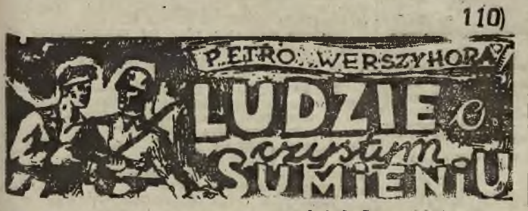
przełożył: Leopold Lewin

Wysokość renty wypłacanej przez Zakład Ubezpieczeń Społecznych wynosić będzie 2.000 zł. plus dodatek na każde dziecko w kwocie zł. 500 miesięcznie. Najniższa emerytura pracownika państwowego, który zarabiał przed wojną do 200 zł., wynosić będzie 2.000 zł. z progresją dla rencistów o wyższych emeryturach. Emeryci samorządowi zostaną zrównani w prawach z emerytami państwowymi. Również ubezpieczeni emerytalnie robotników zostają zrównani z rentą pracowników umysłowych. Emeryci kołejowi uzyskali podwyżkę zaopatrzenia w wysokości 750 zł. wreszcie emeryciom przedsiębiorstw prywatnych przyznano emerytury wypłacane przez ZUS w wysokości zaopatrzenia inwalidzkich.