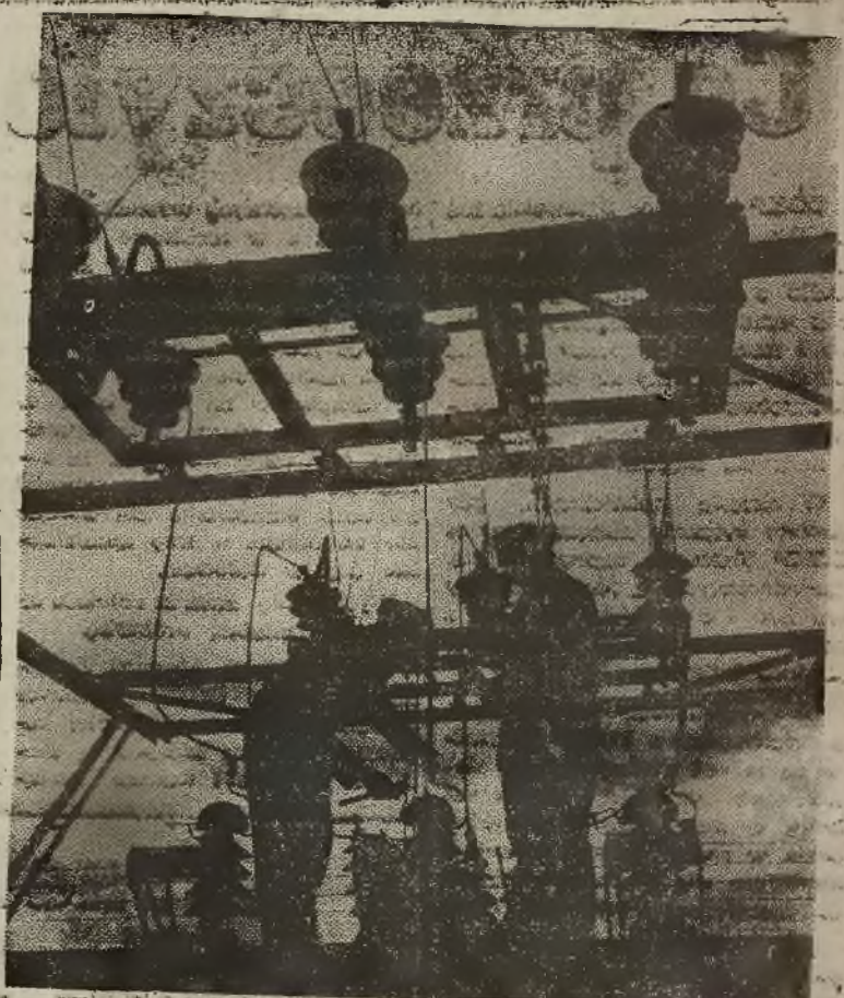
POLSKA. Warszawa powraca do życia - montowanie stacji radionadawczej w Raszynie.