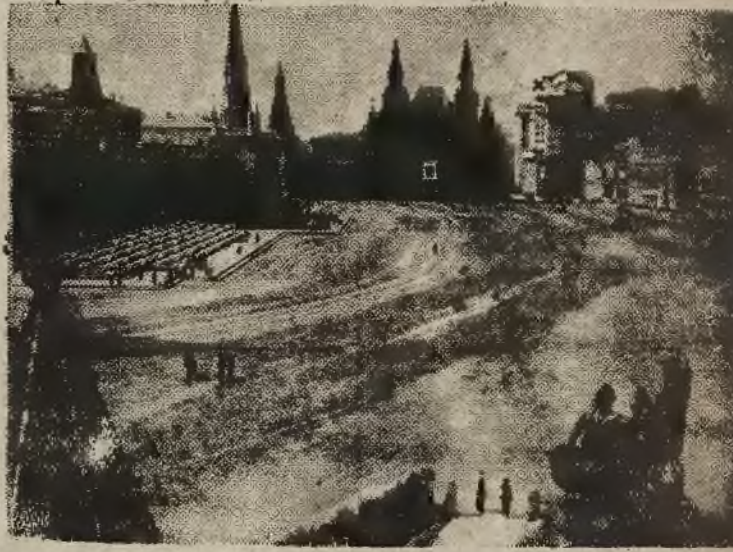
„Ogólny widok na Plac Czerwony w Moskwie. Takim widok go odwiedzi delegacja angielska, francuska i amerykańska, zamieszkała w hotelu „Moskwa”, w którym mieszkają delegacje zagraniczne.