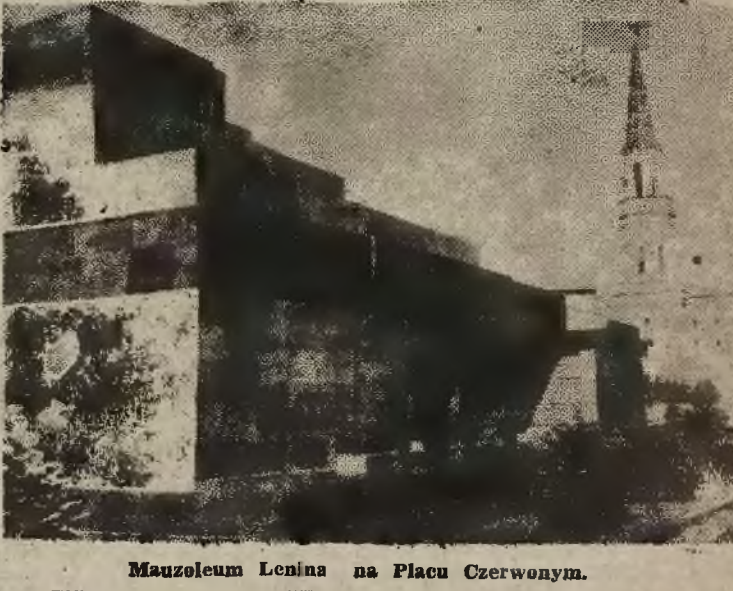
Mauzoleum Lenina na Placu Czerwonym.