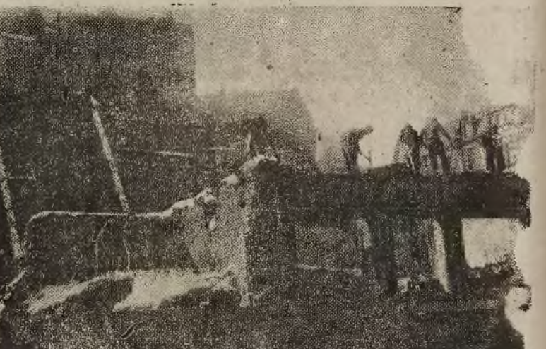
Miasta polskie odbudowują się. Z nastaniem wiosny wzmożił się ruch budowlany