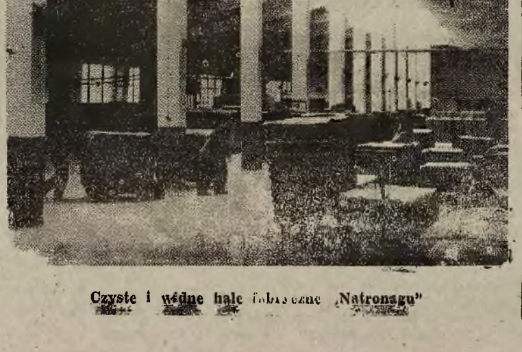
Czyste i wędne hale fabryczne „Natronagu”

Przedstawicielami Rady Za-kładowej, bo z robotnikami rozmawialiśmy nie wiele. Czasem to, co jest jasne od strony dy-rekcji, może mieć splamioną podszewkę