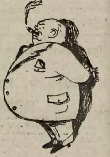
Franklin Delano Roosevelt: Churchill jest wielkim zwolennikiem status quo. On nawet sam wygląda jak STATUS QUO! (cytat z książki gen. Elliot Roosevelta o jego wielkim ojcu)