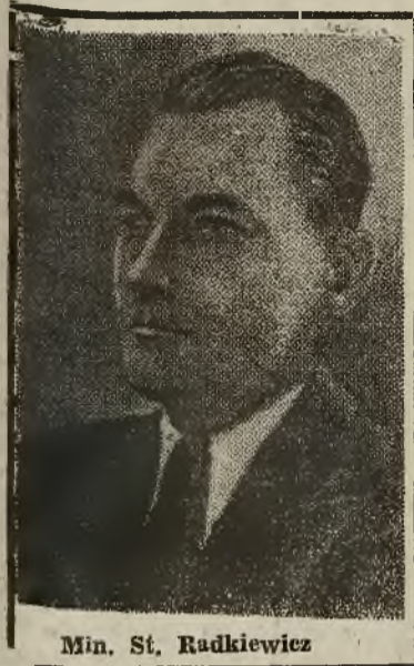
Min. St. Radkiewicz