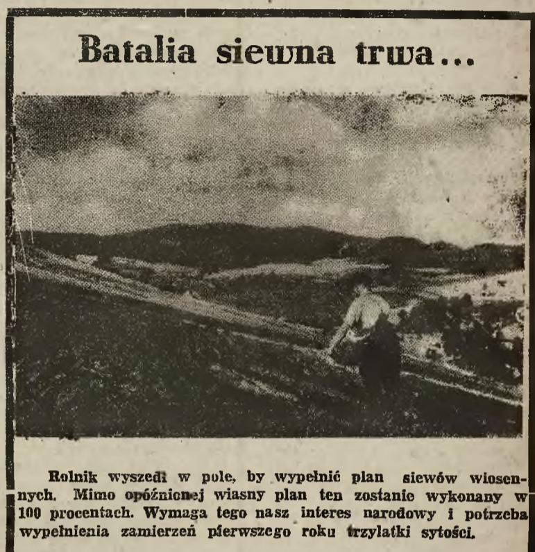
Batalia siewna trwa...

Rolnik wyszedł w pole, by wypełnić plan siewów wiosennych. Mimo opóźnionej wiosny plan ten zostanie wykonany w 100 procentach. Wymaga tego nasz interes narodowy i potrzeba wypełnienia zamierzeń pierwszego roku trzylatki sytości.