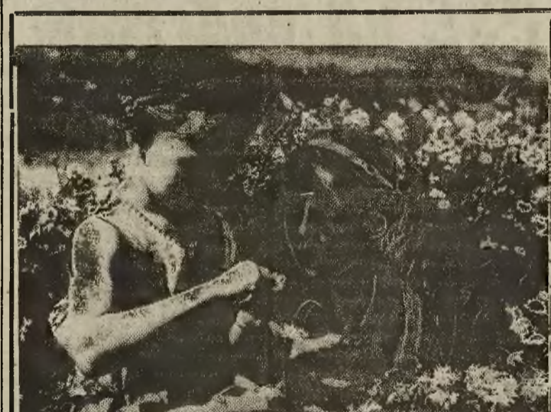
Wojna pozostawiła w młodych organizmach dziecięcych zażyzn niebezpiecznych chorób. Zdajemy sobie z tego sprawę bardzo dobrze. Jednym z naczelnych naszych zadań jest ratować te zagrożone organizmy dziecięce. Musimy pamiętać o tym, że w dzieciach leży przyszłość naszego społeczeństwa. Dajmy dzieciom możliwość wyjazdu tam gdzie słońce, woda, kwiaty i piękno polskiej ziemi rozpromienia dziecięcą twarzyczkę.

W dalszej części listu ob. B. K. uważa, że napis ten powinien być z polskiego kościoła jak najszybciej usunięty, z czym Redakcja nasza oświadcza się zgadzając. Mamy nadzieję, że to słuszna uwaga przywróci się do likwidacji tej smutnej niemieckiej „pamięci”.