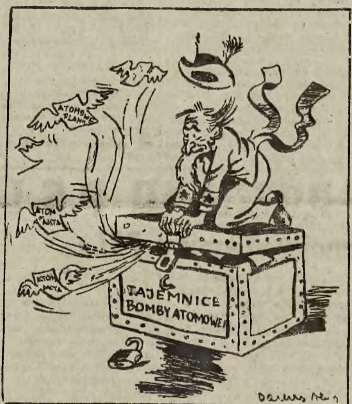
USA starają się wszelkimi siłami utrzymać tajemnice bomby atomowej