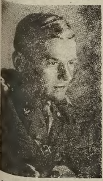
Wojewoda śląsko-dąbrowski gen. A. Zawadzki

Potrzeba budowy nowych szkół dotyczy się ogromnie zaniedbanego pod tym względem Zagłębia Dąbrowskiego, a także Katowic i niektórych miejscowości na Śląsku Opolskim, gdzie szkoły są kom-