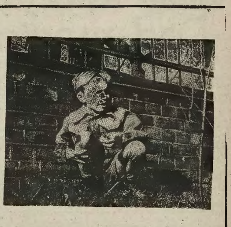
Wiosna warszawska to nie tylko — grzyzy i codzienne zmartwienia i kłopoty, ale to uśmiech dzieci, które z nastaniem ciepłych dni wypełniły wesołą, wrasną warszawską parki. Słońce i świeża zieleń drzew to dla radosnych dziecięcych zabaw.