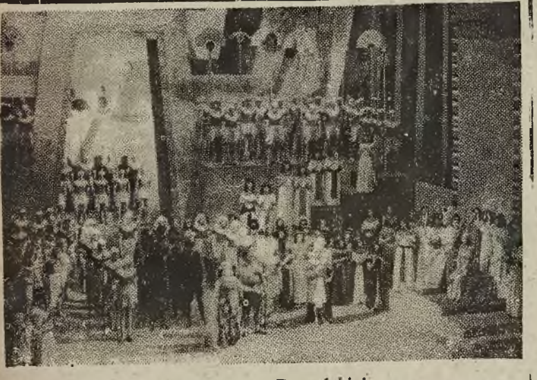
„Aida“ Verdiego na scenie Opery Poznańskiej. Dekoracje i kostiumy projektu art. mal. Zygmunta Szpingera. Fotografia przedstawia akt koronacyjny z udziałem całego zespołu

SZCZECIN (PAP) Dnia 14 bm. opuścił port szczeciński motorowiec „Posejdon“, udając się do portu Istad w Szwecji, celem przewiezienia do Szwecji motorówek z rewindykacji. Przywiezie on również rewindykowany sprzęt morski z Kilonii.