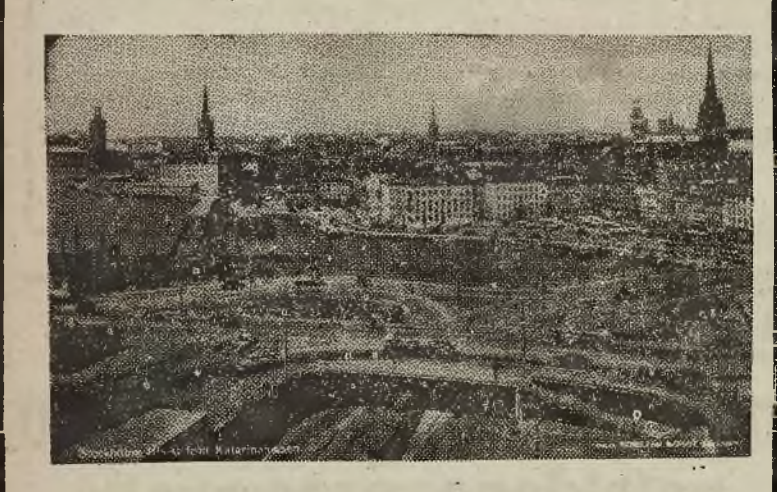
STOCKHOLM. Widok z Katerinehissen na miasto i sławny „ślimak“.

Teraz wystawiając twarz ku ciepłemu słońcu, z lekka kołysani miarowymi ruchami łodzi możemy posłuchać, jak to Szwedzi usiłują raz w rok szaleć. Ma to