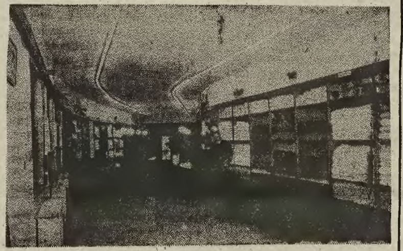
KATOWICE. Powszechny Dom Towarowy.

nie pozostają bez istotnego wpływu na kształtowanie się cen rynkowych, szczególnie na te asortymenty towarów, które są do nabycia w „Domach Towarowych”. Fakt, że w Gliwicach, w Katowicach i Bielsku na głównych ulicach tych miast kupyki umieszczają wywieszki o „nacznej obniżce cen artykułów włókienniczych