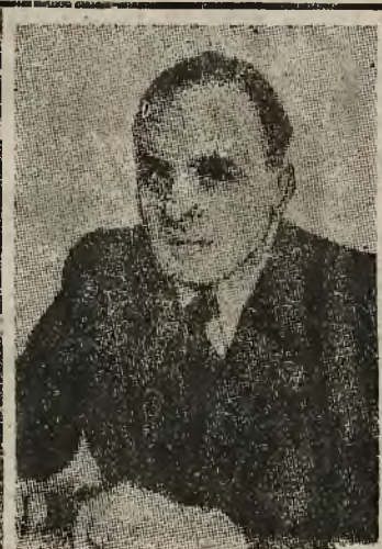
TOW. MIN. J. BERMAN

frontu było koordynowanie wysiłków obu partii, współpraca na terenie fabryki, wspólna walka z reakcją, wspólna kampania wyborcza.