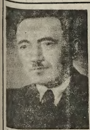
Prezydent R. P. BOLESŁAW BIERUT

AMMAN wtorek W stolicy Transjordanii — Ammanie 20 maja odbyła się demonstracja i proklamowano strajk powszechny na znak protestu przeciwko prześladowaniu działaczy demokratycznych i osób, pozostających w opozycji wobec rządu, oraz przeciwko samowoli władz w ustalaniu i ściąganiu podatków.