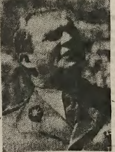
Lud wsi i miast, chłop i robotnik, zrozumiełi wspólnotę...