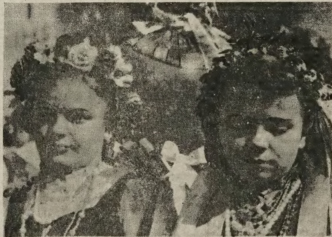
W pochodach i manifestacjach w dniu Święta Ludowego brali udział chłopcy w swoich strojach ludowych. Na zdjęciu: fragment z uroczystości ludowych w Opolu.