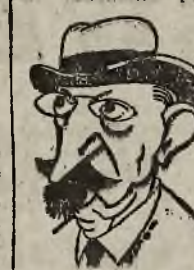
Maximos, premier grecki