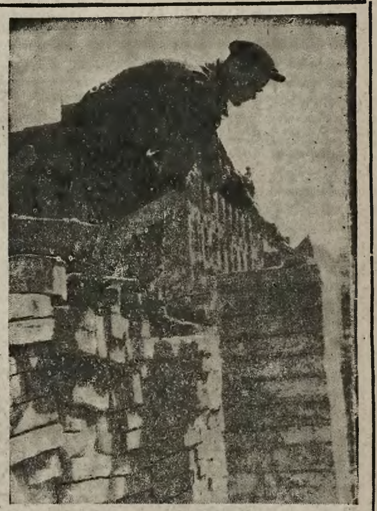
Rozmach z jakim Polska odbudowuje zniszczenia wojenne wywołuje podziw na całym świecie. Dowodem tego jest chociażby wiele artykułów, jakie ukazały się w prasie francuskiej po paru dniach wycieczki dziennikarzy francuskich z Polski. Wyjątek z jednego z tych artykułów zamieszczamy w „Przeglądzie prasy zagranicznej” na stronie 2-giej.

Berliński korespondent „New York Times” CLARK omawia na łamach tego dziennika niezwykle szerokie kompetencje w jakie została wyposażona nowoutworzona niemiecka rada ekonomiczna. Rada ta nie tylko została poddana reorganizacji wszystkich dziedzin życia gospodarczego Niemiec z prawem wydawania dekretów, przepisów wykonawczych określających sankcje i ściągania kar za nie wykonanie jej zarządzeń, ale że może ona również mianować dyrektorów poszczególnych działów bez zatwierdzenia zarządu wojskowego.