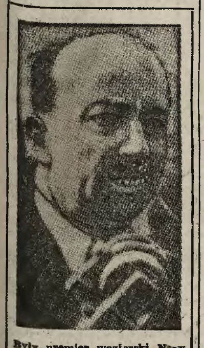
Były premier węgierski Nagy

NAGY FERENZ , b. premier rządu węgierskiego i przewodniący partii drobnych posiadaczy, wywołał niebywałą sensację w świecie politycznym, odznaczając się do Węgier na powołanie członków rządu i bliższe polityczne swojej partii.