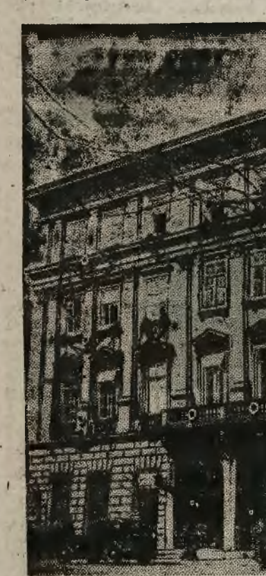
Gmach Robotniczego Domu Kultury w Krakowie.