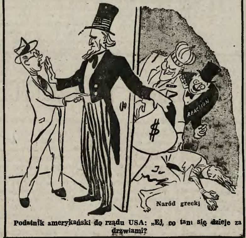
Podstak amerykański do rządu USA: „Ej, co tam się dzieje za drzwiami?”

RYM, niedziela W kołach politycznych krąży pogłoski o ewentualnej dymisji prezydenta Włoch de Nicola, która miałaby nastąpić w dniu 24 czerwca, t. j. w dniu możliwości rozwiązania obecnego Zgromadzenia Konstytucyjnego.