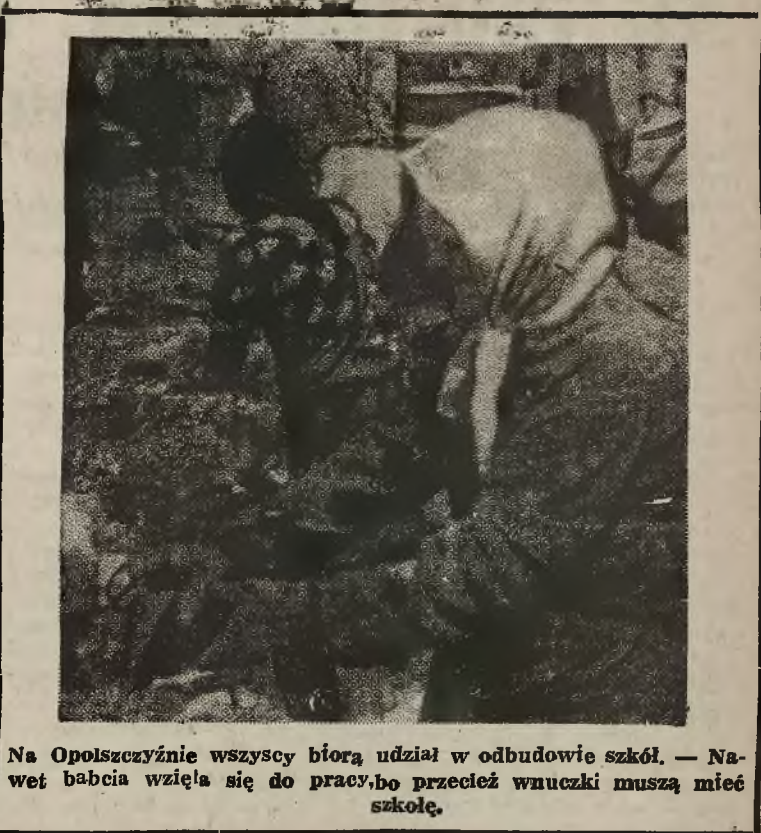
Na Opolszczyźnie wszyscy biorą udział w odbudowie szkół. — Nawet babcia wzięła się do pracy, bo przecież wnuczki muszą mieć szkołę.

Dalszy ciąg plenarnych obrad Sejmu odbędzie się w poniedziałek, dnia 23 bm. o godz. 10-ej rano.