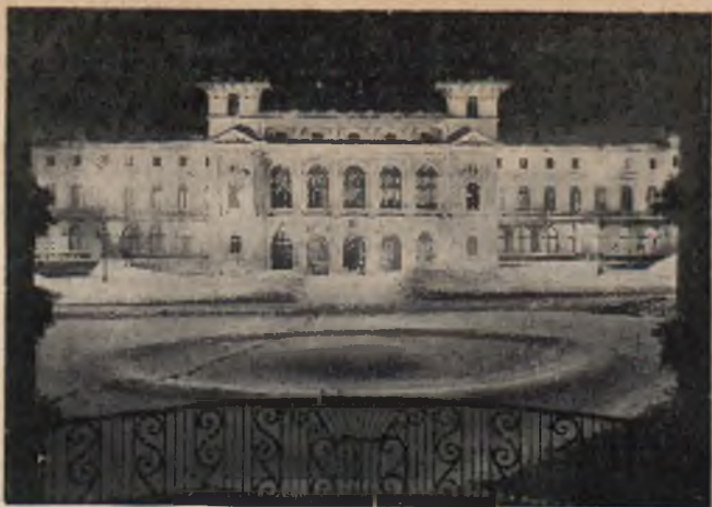
Dom Zdrojowy w Krynicy. Foto St. Mucha Kraków