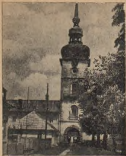
STARY SĄCZ. Klasztor SS. Klarysek. — Brama wjazdowa.

miasta kilka zamków w górach. Zamek zniszczyli Szwedzi za Jana Kazimierza; handlowe znaczenie miasta upadło z czasem na rzecz Nowego Sącza. Najstarszym i najpiękniejszym budynkiem Starego Sącza jest kościół Klarysek wraz z klasztorem, którego założenia przypisują św. Kindze w r. 1260, która też tu zmarła. Do tego klasztoru wstąpiła także siostra jej Helena, czyli Jolanta, wdowa po Bolesławie, księciu kaliskim, a później także Jadwiga, córka Władysława, księcia pomorskiego, wdowa po Władysławie Łokietku.