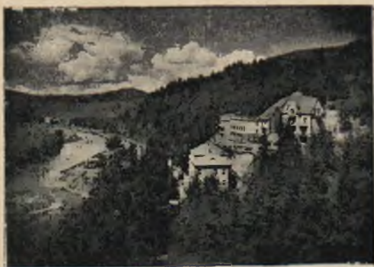
Żegiestów. Nowe pensjonaty.

ŹRÓDŁA I KLIMAT. Wody żegiestowskie (szczawy wapniowo-żelaziste), zawierają w obfitej ilości dwuwęglan żelaza, dwuwęglan manganu, litowy, wapniowy i sodu przy obfitej ilości bezwodnika węglowego. Wody te służą zarówno do picia jak i do kąpieli. Do najpopularniejszych źródeł zalicza się Zdrój „Anny“ dostarczający jednej z najsilniejszych w Europie szczawy żelazisto-wapniowo-magnezowej z niezwykle obfitością wolnego bezwodnika kwasu węglowego. Wytryska u podnóża góry Czerszli, w centrum zakładu, dobywając się w dużych, gwałtownych wybuchach, z pośród szczelin piaskowca karpackiego. Zdrój „Andrzeja“ niezwykle cenny, ze względu na dużą zawartość w wodzie soli magnezowych, dostarczający bardzo silnej szczawy żelazisto-magnezowo-wapniowo-sodowej, dowiercony na głębokości 252 m., znajduje się również w centrum zdroju. Zdrój „Szulim“. Woda ze źródeł szulimskich jest szczawą alkaliczno-słoną z dość znaczną zawartością soli kuchennej i litu. Niezwykle jej skutki lecznicze, podziwiają rok rocznie chorzy przedewszystkiem z zaburzeniami przemiany materii.