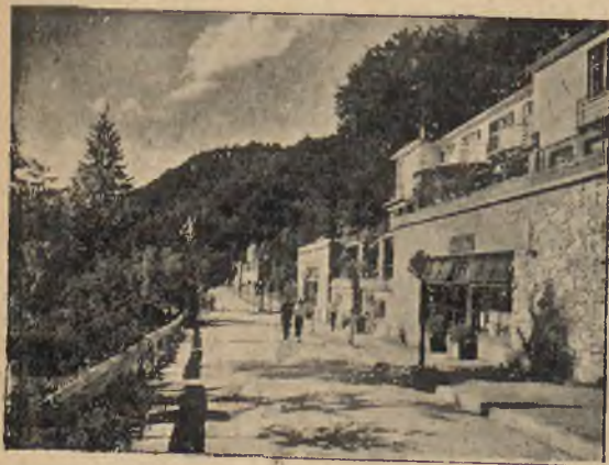
Żegiestów. Deptak.

Wskazania lecznicze. Używanie wód mineralnych żegiestowskich wskazane jest w następujących chorobach: blednicy, niedokrewności, zimnicy, w schorzeniach nerwów, osłabieniu nerwowem, ogólnej neurastenii, niemocy pściowej, w chorobach serca: tak mięśnia sercowego jak i zastawek, chorobach naczyń krwionośnych, miażdżycy tętnic tak wewnętrznych jak i obwodowych, w chorobach nosa, gardła, dróg oddechowych, a więc po zapaleniach oskrzeli, oraz po zapaleniach płuc i opłucnej, w stanach chorobowych na tle zaburzeń gruczołów o wydzielaniu wewnętrznym, a więc np. jajników gruczołu tarczycowego i innych, przy wypadaniu koniecznych dla zdrowia hormonów, w chorobach części rodnych kobiecych, po przebytych zapaleniach tychże i przydatków, w zaburzeniach w miesiączkowaniu i w okresie przekwitania, w chorobach przemiany materii, w chorobach żołądka i jelit na tle nerwowem, w stanach rekonwalescencji po przebytych ostrych chorobach.