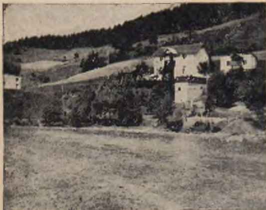
MUSZYNA - ZDRÓJ. Widok na Poprad. Na wzgórzu pięknie położona willa - pensjonat „Temida“ pp. Wierzbowskich.

Od zachodniej strony miasta, w miejscu, gdzie rzeczka Muszynka wpada do Popradu, stoi skaliste wzgórze, zwane zamczyskiem z zaledwie widniejącymi szczątkami muru i kawałka wieży; są to ostatnie ślady warownego grodu, który strzegł granicznych rubieży. Według tradycji zamek pochodzi z XII w. i miał być zbudowany przez Węgrów. W r. 1301 przeszedł wraz z miasteczkiem na własność krakowskiego biskupa Muskaty, od którego nazwiska miała powstać nazwa Muszyna; następnie przeszedł na rzecz korony, lecz Zbigniew Oleśnicki odzyskał go znów dla biskupstwa. W wojnach za Kazimierza Jagiellończyka oblegali go Węgrzy. Opuszczony za Jana Kazimierza, nie odnowiony, rozsypał się prawie doszczętnie.