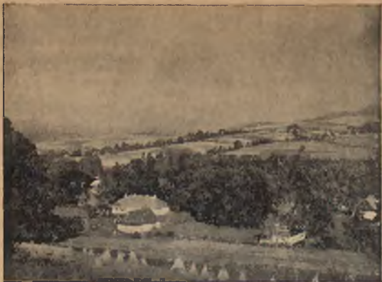
WIDOK OGÓLNY PORĘKY, WIELKIEJ.

Poręba Wielka jest rodziną wsią zgasłego przed kilku laty słynnego pisarza i miłośnika Podhala Władysława Orkana.