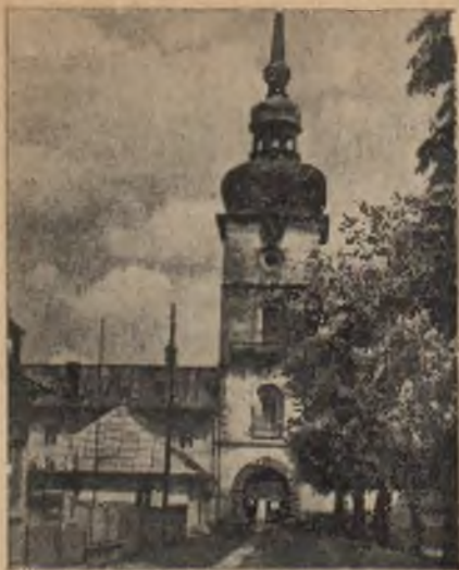
STARY SĄCZ. Klasztor SS. Klarysek. — Brama wjazdowa.

miasta kilka zamków w górach. Zamek zniszczyli Szwedzi za Jana Kazimierza; handlowe znaczenie miasta upadło z czasem na rzecz Nowego Sącza. Najstarszym i najpiękniejszym budynkiem Starego Sącza jest kościół Klarysek wraz z klasztorem, którego założenia przypisują św. Kindze w r. 1260, która też tu zmarła. Do tego klasztoru wstąpiła także siostra jej Helena, czyli Jolanta, wdowa po Bolesławie, księciu kaliskim, a później także Jadwiga, córka Władysława, księcia pomorskiego, wdowa po Władysławie Łokietku. Pierwotna budowa była gotycka, zresztą został kościół przerezbiony, przeładowany barokowymi ołtarzami, nieudolnie przemalowany mimo sprzeciwu grona konserwatorów. W kościele zachowało się wiele pomników staropolskiej sztuki, szczególnie obrazów; jeden ich cykl przedstawia sceny z życia św. Kingi. Bardzo ładną jest krata oddzielająca chór zakonnic od kościoła. Godna uwagi jest ambona hebanowa z XIV w. i arcydzieło rzeźbiarstwa, Chrystus na krzyżu. Trzy ołtarze z drzewa i marmuru, na jednym z nich stoi srebrna trumna z relik. św. Kingi. W lewej nawie płyta grobowa królowej Jadwigi, żony Władysława Łokietka. Z pamiątek po św. Kindze zachowała się jeszcze przekształcona na kaplicę jej cela, puhar i skała z Pienin ze śladami jakby „stopki św. Kingi“, oraz pierścień, wiążący się z legendą o salinach.