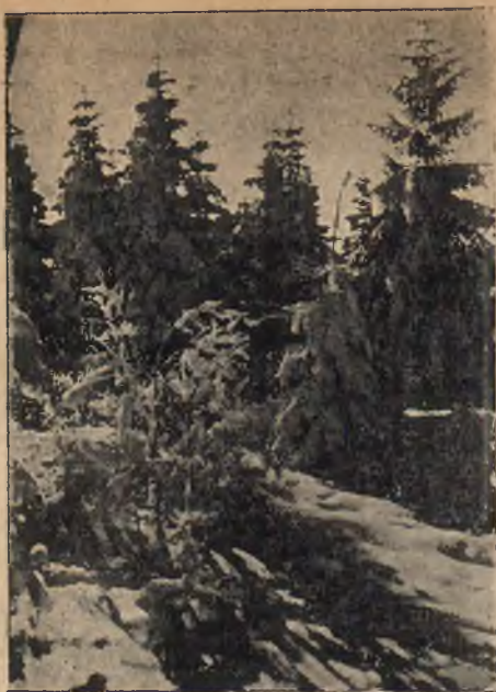
Krynica, widok z góry parkowej.

borowiny znajdują się w wielkiej ilości w najbliższej okolicy zdrojowiska. Urządzenia lecznicze: Nowe łaźienki (160 wanień I klasy i 8 luksusowych) łaźienki w Domu Zdrojowym. Stare łaźienki na deptaku (109 wanień I, II, i III kl.), łaźienki borowinowe (131 wanień wszystkich klas), pijalnie wód mineralnych w krytym deptaku ogrzany zimą.