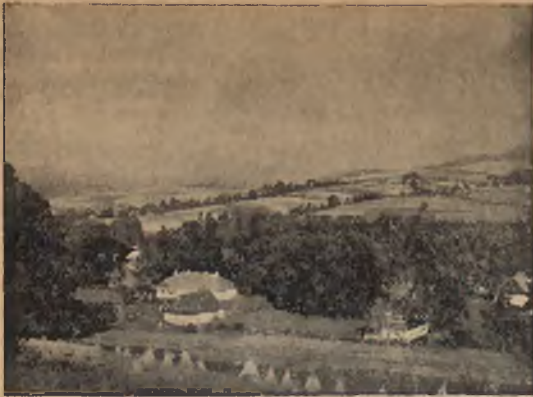
WIDOK OGÓLNY PORĘKY, WIELKIEJ.

Poręba Wielka jest rodziną wsią zgasłego przed kilku laty słynnego pisarza i miłośnika Podhala Władysława Orkana.