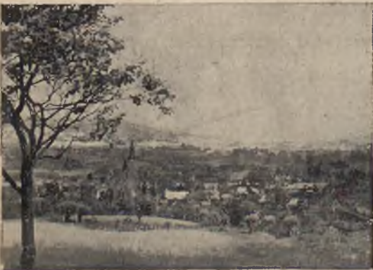
LIMANOWA. — WIDOK OGÓLNY.

W okolicach Limanowej jak zresztą w całym powiecie są wspaniałe tereny narciarskie z pięknymi i długimi zjazdami. Powiat limanowski posiada 1 gminę miejską Limanową; są wprawdzie jeszcze miasteczka, jak Mszana Dolna i Tymbark, lecz są one gminami zbiorowymi wiejsk.