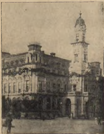
NOWY SĄCZ. Gmach Zarządu Miejskiego, budowla z roku 1895.

Schludne, nowoczesnie rozbudowane miasto o 32.000 mieszkańców, należące do województwa krakowskiego, oddalone 175 klm. od Krakowa przez Tarnów. Położone 299 m. n. p. m., w obszernej kotlinie zewsząd otoczonej górami, jest ważnym ośrodkiem ruchu turystycznego. Posiada dwa dworce kolejowe: przystanek tuż pod rynkiem dla podróżnych od strony Chabówki, i dworzec główny, oddalony o 2 klm. od centrum miasta, dla podróżnych na linii kolejowej Kraków — Nowy Sącz — Krynica. Dworzec główny ozdobiony w przedsiönku krajobrazami górskimi pędzla E. Cieczkiewicza. Nowy Sącz jest siedzibą: Starostwa powiatowego, Sądu okręgowego, Urzędu