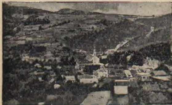
Piwniczna — widok ogólny

Nieznane dla szerszego społeczeństwa uzdrowisko Piwniczna, posiada obfity źródł wody mineralnej do picia i kąpielni, oraz wielkie złoża borowiny.