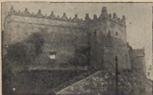
NOWY SĄCZ. Zamek Królewski, założony przez króla Kazimierza Wielkiego w r. 1365.

Nowy Sącz pierwszy z miast polskich stał się ofiarą zaborów; już w r. 1770 zajęto go wraz ze Spiszem i przyłączono do Węgier. Zarówno w r. 1831 i 1863 istnieją w Nowym Sączu organizacje powstańcze. Rok 1847, rebelii chłopskiej. Rok 1914 dostarcza legionom polskim szereg walecznych bojowników, w grudniu 1914 r. bawi w Nowym Sączu Marszałek Józef Piłsudski i Legiony, po wypędzeniu Rosjan z pod Limanowej i Marcinkowic. W niepodległej Polsce odgrywa miasto dużą rolę, jako duchowa stolica ziem podhalańskich.