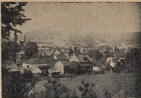
OGÓLNY WIDOK MSZANY DOLNEJ.

Wielka, Dobra, Szczyrzyce i Tymbark. Krótki opis tych miejscowości podaje niżej.