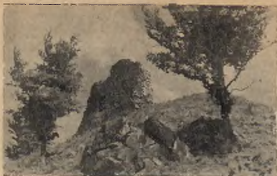
Ruiny zamku raubryterskiego z XI w.

(949 m.), na Pisaną Halę (1044 m.), oraz na wielki Rogacz (1182 m.). Malowniczość Rytra podnoszą ruiny zamku raubryterskiego z XI. wieku.