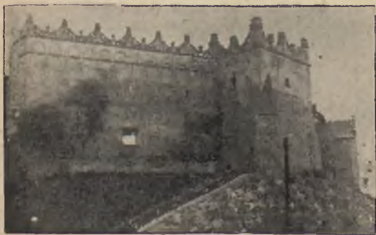
NOWY SĄCZ. Zamek Królewski, założony przez króla Kazimierza Wielkiego w r. 1365.

Nowy Sącz pierwszy z miast polskich stał się ofiarą zaborów; już w r. 1770 zajęto go wraz ze Spiszem i przyłączono do Węgier. Zarówno w r. 1831 i 1863 istnieją w Nowym Sączu organizacje powstańcze. Rok 1847, rebelii chłopskiej. Rok 1914 dostarcza legionom polskim szereg walecznych bojowników, w grudniu 1914 r. bawi w Nowym Sączu Marszałek Józef Piłsudski i Legiony, po wypędzeniu Rosjan z pod Limanowej i Marcinkowic. W niepodległej Polsce odgrywa miasto dużą rolę, jako duchowa stolica ziem podhalańskich.