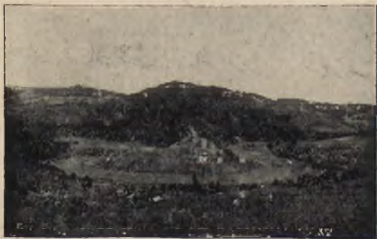
Piwniczna, widok na przełom Popradu.

Piwniczna jest również odwiedzana w porze zimowej ze względu na piękne tereny narciarskie na stokach okolicznych gór.