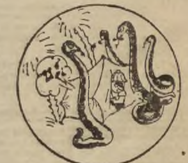
A mówilem ci, żebyś w dżungli e grał na flecie!