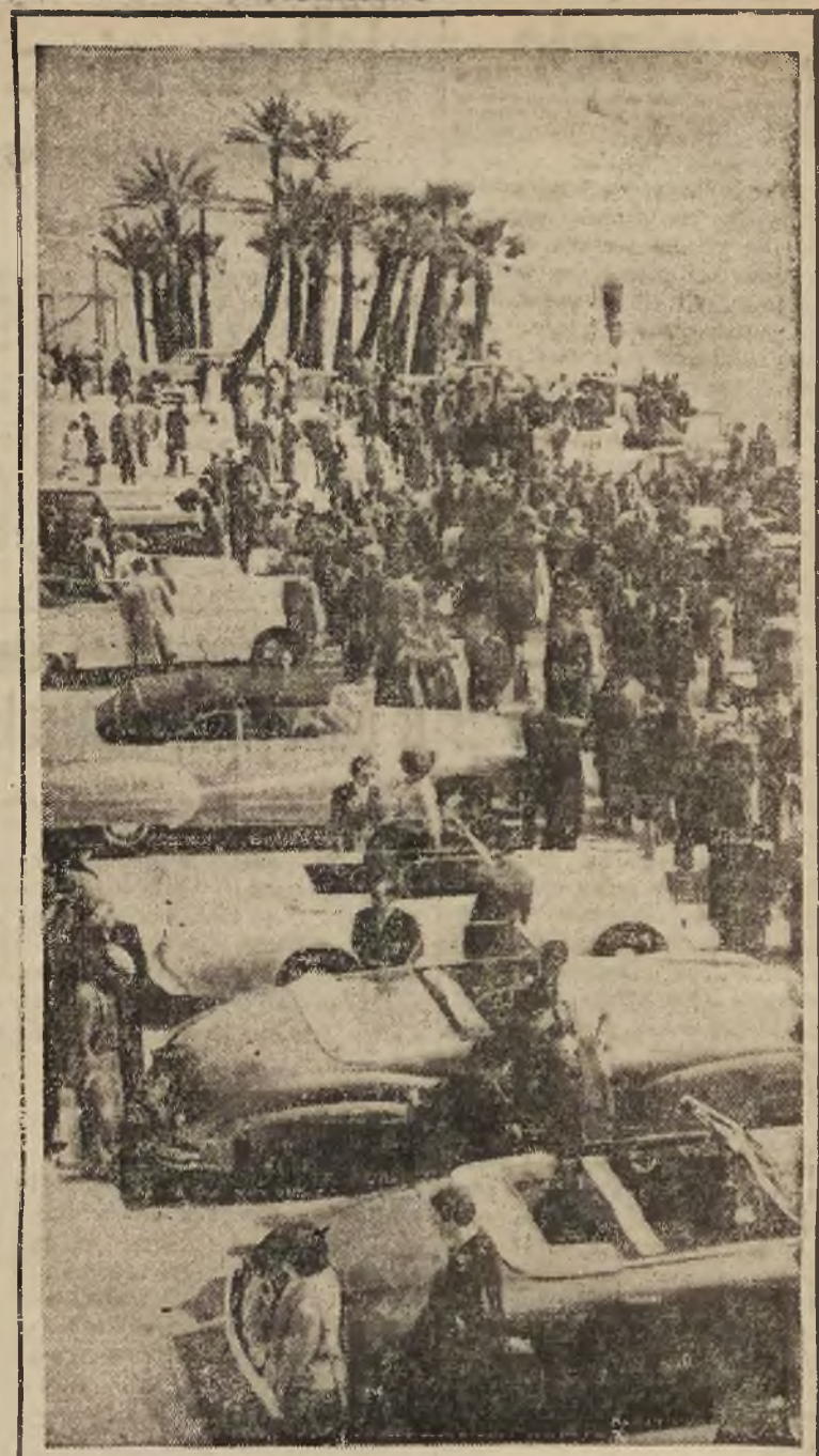
Niedawno odbył się 28-my pokaz wytworności samochodów w Monte Carlo na tarasach kasyna gry.

Podrapał się w głowę. Czyż odczyt się przez jeden wieczór mówić „tak panie“ i „tak, psze pani“ do białych, kiedy przyzwyczajał się do tego całe życie? Zapatrzył się przed siebie, żeby nie spotkać ich spojrzeń. Kiedy kelnerka podeszła, Jan zamówił trzy piwa i trzy porcje kurczęcia. — Hi, Bigger. Odwrociwszy się, zobaczył Jacka, który pozdrowił go ruchem ręki, zapatrzonej w Jana i Mary. Szywno machnął ku niemu dłonią. Psiakrew! Jack szybko odskoczył. Bigger rozejrzył się ostrożnie. Przyglądały mu się kelnerki i wszyscy goście. Wszyscy go tu znali i dziwili się tak samo, jakby on się dziwił na ich miejscu. Mary dotknęła jego ramienia. — Czyś tu już bywał? Szukał słów, które ukryły by uczucia. — Tak, parę razy. — Bardzo tu miło — powiedziała Mary. Ktoś włożył monetę w automatyczny fonograf, pociekły tony. Bigger poczuł rękę na ramieniu. — Hi, Bigger. Gdzieżeś się podziewał? Podniósłszy głowę, napotkał śmiejące się oczy Bessie. — Hi — warknął. — Przepraszam, nie widziałam, że jesteś w towarzystwie — powiedziała, odskakując, ale nie odwracając oczu od Jana i Mary. — Poproś ją, niech siada z nami, Bigger — powiedziała Mary. Bessie odeszła do dalszego stolika, gdzie usiadła przy innej dziewczynie. — Poszła — wytłumaczył Bigger.