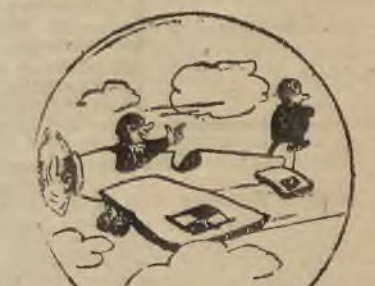
No, przestań się złościć i chodź tu z powrotem!