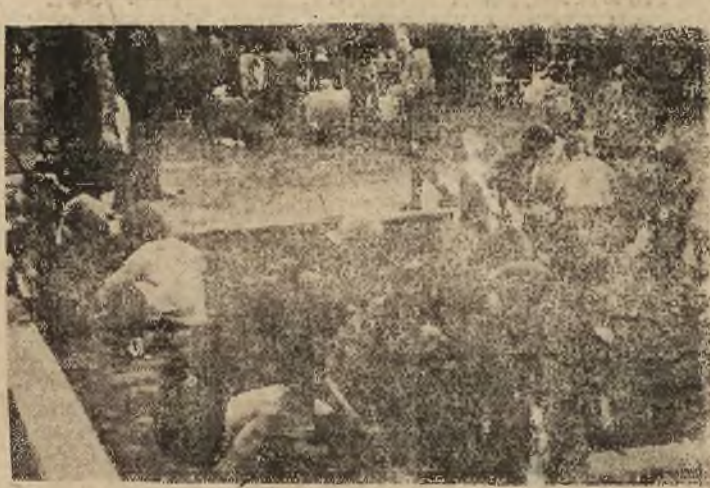
Bez troski dzieci...

Ciężkie walki trwają w Brebes, na północnym wybrzeżu. Wojska republikańskie odzyskały Gonnangpati na południowym wschód od portu Semarang, po upływie 4 godzin od zajęcia miasta przez czołgi holenderskie. Naczelny dowódca indonezyjski gen. SUDIRMAN oświadczył, że republikańskie wojsko prowadzi nierówną walkę, lecz dodał, iż powodzenia holenderskie polegające na zajmowaniu większych miast nie mają zbyt wielkiego znaczenia. Indonezyjczy ci przedkładają do taktyki walki partyzanckiej.