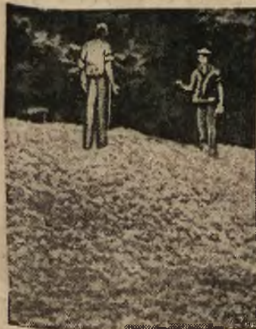
...tysiące ton kartofli ...niszczy się