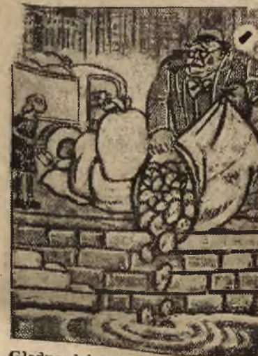
Głodna dziewczynka: Proszę pana czy te kartofle zostaną ugotowane?