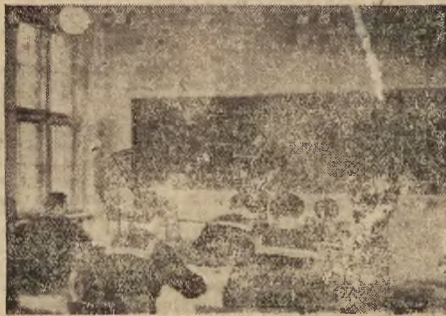
W Państwowej Szkole Morskiej w Gdyni