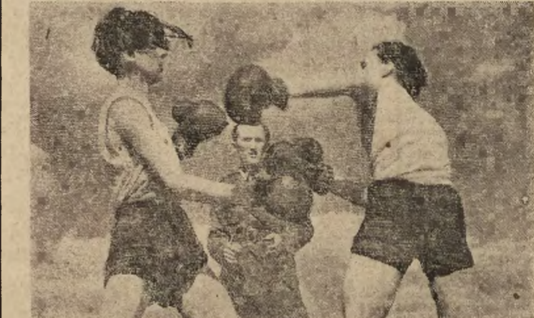
Zołnierze umieją nie tylko maszerować i śpiewać, nie tylko zaprawiają się w bojowych ćwiczeniach. Poza mu ramy koszar, które wydają na pozór bezbarwne i ponuro, — życie żołnierskie jest bardzo urozmaicone. A okres szkolenia przydaje się nie tylko w czasie wojny; młodzi chłopcy, prowadząc zdrowy tryb życia i uprawiając sporty zdobywają hart ducha i ciała na całe życie. Powyższe zdjęcie przedstawia lekcję boksu w cza sie wolnym od zajęć.

SOFIA, sobota W Sądzie Obwodowym w Sofii w dniu 5-go sierpnia br. rozpoczęła się rozprawa przeciwko byłemu przywódcy opozycji Nikoły PETKOW, oskarżonemu o prowadzenie działalności antyludowej. W dniu wczorajszym ogłoszono w Sofii, że proces powyższy będzie jawny.