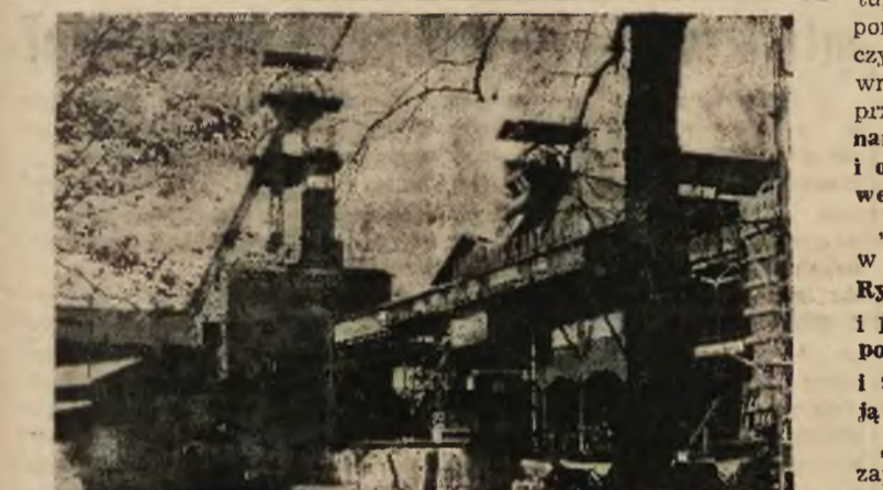
Nasze kopalnie tętnią pracą. Wyciągi raz po raz wyrzucają węgiel wydobywany wysiłkiem górników.

Obowiązkami rad zakładowych i kół partyjnych przy zakładach pracy jest nastawienie się na współdziałanie w badaniu procesów produkcji.