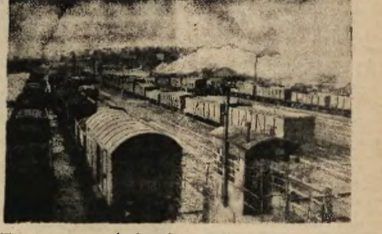
Wyurty z wnętrza ziemi węgiel, załadowany na pociąg, idzie w szeroki świat.

Rozpoczął się tutaj proces 19 SS-manów, kierowników i strażników sekcji obozowej znanej pod nazwą KZ-Dora. Oskarżonym zarzucano, że w czasie ich dwuletniego urzędowania poniosło w obozie śmierć 15.000 więźniów. Adwokat tego obozu wyższy oficer SS, niejaki Stepmann, skazany został już przedtem na odrębną rozprawę na 15 lat ciężkich robót.