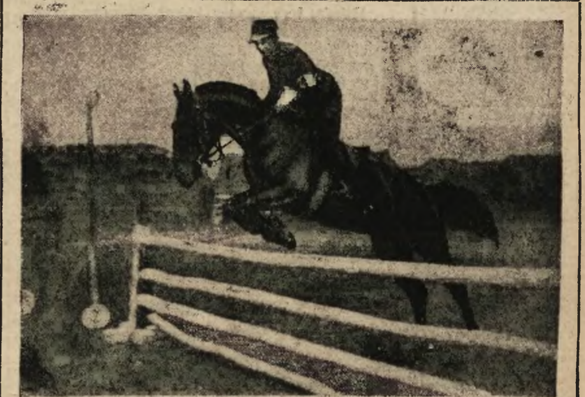
Nasi kawalerzyści okrwali się na przestrzeni dziejów nieśmierlną sławą. W czasie pokoju słynęli na świecie jako jedni z najlepszych jeźdźców. Pielęgnowujemy te tradycje w dalszym ciągu — na zjeździe pochylony ku przodowi, lekko skacze przez przeszkodę na zawodach hippicznych, które odbyły się przedwczoraj w Katowicach.