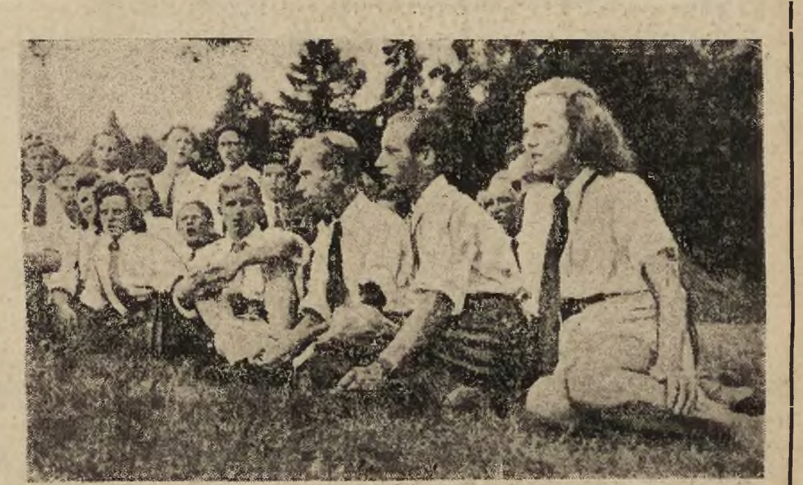
Kończą się wczasy. Młodzież w obozach ZWM-u i OMTUR-u, po beztrudnym i pożytecznie spędzonym okresie wypoczynku wróci do nauki i do pracy społecznej w swoich organizacjach. Wie ona o tym, że jest awangardą polskiej młodzieży, gwarantującą przyszłości Polski. W ich szeregach są ci, którzy w czasie okupacji rozumieli konieczność przebudowy społecznej, która dawałaby pełną gwarancję niepowtórzenia się faszyzmu Berez - Kartuskich i Oświęcimów. Manifest Lipcowy PKWN wykreślił drogę dostatecznie szeroką dla całej Polski. Dlatego poszli tą drogą — dlatego zwyciężą.

BERLIN, czwartek Oficjalny komunikat brytyjski stwierdza że władze brytyjskie wydadzą władzom radzieckim wszystkich zbrodniarzy, którzy należeli niegdyś do 9 batalionu rezerwowego policji niemieckiej i zostali obecnie znalezieni w strefie brytyjskiej. Jak wiadomo, batalion ten odznaczył się specjalnym okrucieństwem i do konfliktów masowych mordów obywateli radzieckich. Wśród wydanych dotychczas władzom radzieckim 247 żołnierzy 9-go batalionu nie było oficerów z wyjątkiem jednego majora.