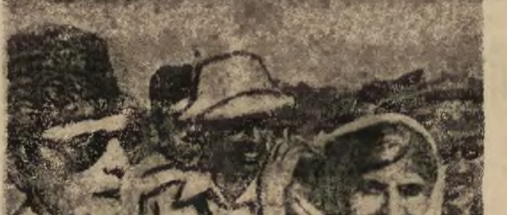
Jinnah po przybyciu do stolicy

Pod względem geograficznym Pakistan nie stanowi zwartej przetrzety. W rzeczywistości jest to nie jeden kraj, lecz - dwa. Istnieje Pakistan północno - zachodni i północno - wschodni, oddzielone od siebie terytorium indyjskim, szerokości 2.000 km. Ludność Pakistanu wynosi ok.