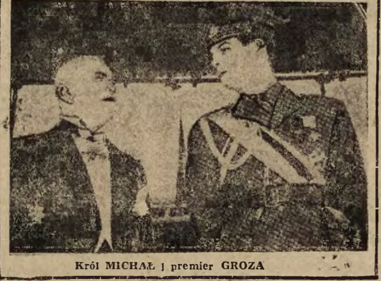
Król MICHAŁ i premier GROZA

Minister Snyder odmówił na niedawnej konferencji prasowej wszelkich komentarzy na temat zapowiedzianej konferencji i oświadczył jedynie, że konferencja ograniczy się do spraw ściśle finansowych i nie poruszy żadnych zagadnień, związanych z krytyczną sytuacją gospodarczą Wielkiej Brytanii i pomocą dla Europy Zachodniej.