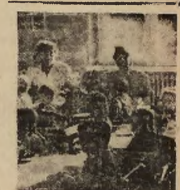
Dzieci na koloniach letnich.