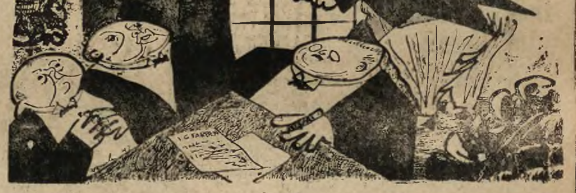
Uwaga — zróbcie mię biedaków zasługujących na pomoc NADCHODZI HOOVER.

W Norymberdze odbywa się proces 24 dyrektorów I G Farben Industrie oskarżonych o zbrodnice działalność w czasie wojny. Przed kilku dniami amerykański Zarząd Wojskowy ogłosił, że przedsiębiorstwa I G Farben wrócić do swoich właścicieli. Jak wiadomo, akcje I G Farben po większej części należą do koncernu stalowego Vereinigte Stahlwerke i rodziny fabrykantów Kruppa