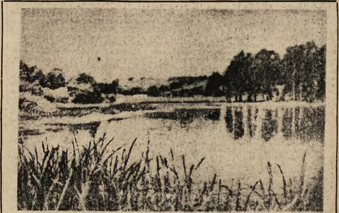
Nie tylko Szwajcaria ma piękne widoki wzgórz, lasów, łąk, jezior i szuwarów przybrzeżnych. Mamy w Polsce własną Szwajcarię, do której nie trzeba ani wiz ani dewiz — Szwajcarię Kaszubską. Między Połczynem a Czaplinkiem, w dolinie pięciu jezior, zrobiono zamieszczone przez nas zdjęcie.

LONDYN, poniedziałek W niedzielę odbyło się pod przewodnictwem premiera Attleego posiedzenie gabinetu brytyjskiego. Jak się przypuszcza, tematem obrad była sprawa wprowadzenia w życie szeregu nadzwyczajnych zarządzeń, związanych z obecnym kryzysem gospodarczym Anglii.