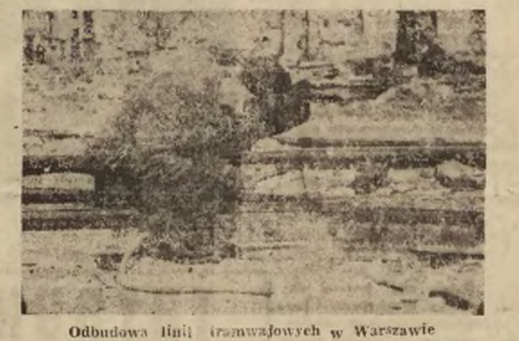
Odbudowa linii tramwajowych w Warszawie

Warto zwiędzić taką fabrykę. Pracuje tu na razie 400 robotników. Pracuje równocześnie nad odbudową, wywożeniem gruzów, remontowaniem maszyn oraz rozwojem produkcji. Produkuje różnorodnej, która — obok naprawy maszyn i narzędziowni — obejmuje wyrob najróżnorodniejszych przyrządów pomiarowych: suwmiarek, sprawdzianów szkiełkowych, płyt kontrolnych, liniałów, płytek pomiarowych, które mierzą z dokładnością do 0,0001 mm.