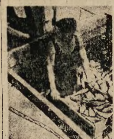
RYBY — BOGACTWO POLSKICH WOD