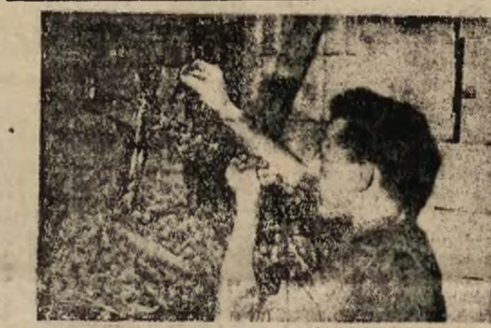
W fabrykach ozdób szklanych myślą już o Bożym Narodzeniu