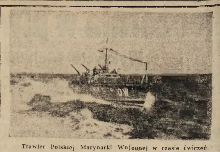
Trawler Polskiej Marynarki Wojennej w czasie ćwiczeń