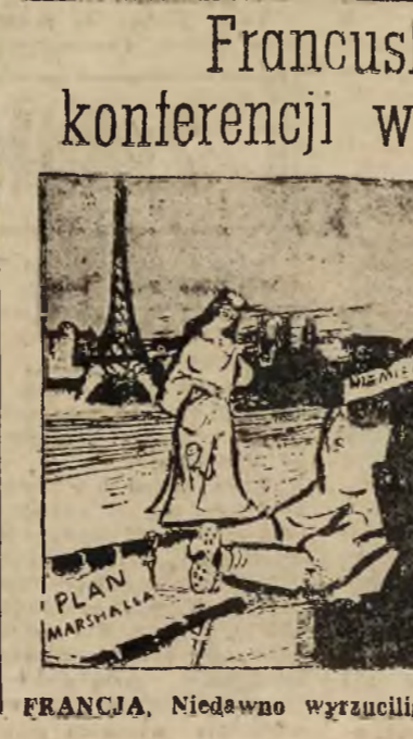
Francuska ocena konferencji waszyngtonskiej

W kołach poinformowanych twierdzą, że w łonie gabinetu istnieje całkowite rozbieżności poglądów co do warunków, na jakich Francja winna rozpocząć pertraktacje pokojowe z rządem Republiki Wietnamskiej.