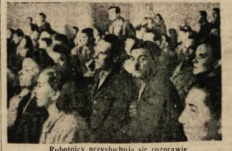
Robotnicy przysłuchują się rozprawie