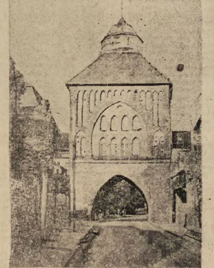
Wzrost — część zachowanych murów obronnych — Nowa Brama Gótycka