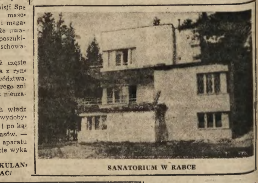
SANATORIUM W RABCE

SZCZECIN 50 STĄTKÓW Z RUDA Do portu szczecińskiego w tym roku przybyło już 50 stątków rudy. Przywiozły one pod swym pokładem 38 tys. ton rudy żelaznej.