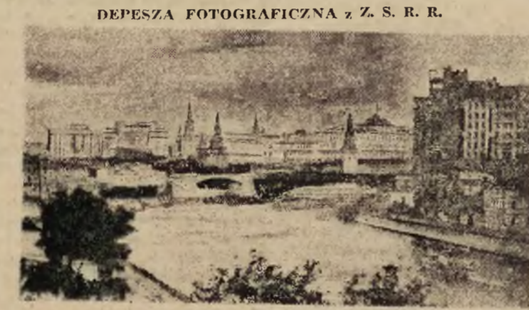
Widok znad rzeki Moskwy. Od lewej ku prawej (na drugim planie): Gmach Rady Ministrów, hotel „Moskwa”, kopuła Kremła.