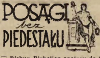
POSĄGI bez PIEDESTAŁU