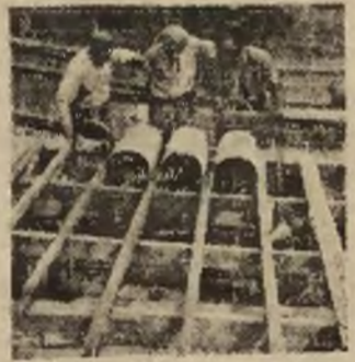
Przy odbudowie zakładu pracy

W celu podniesienia do maksymalnej granicy plac robotniczych postanowiono zwrócić specjalną uwagę na zwiększenie norm obsługi maszyn, co z kolei pozwoli na całkowite wykorzystanie zdolnego do produkcji, a bezczynnego na razie ze względu na brak sił ładowczych, parku maszynowego.