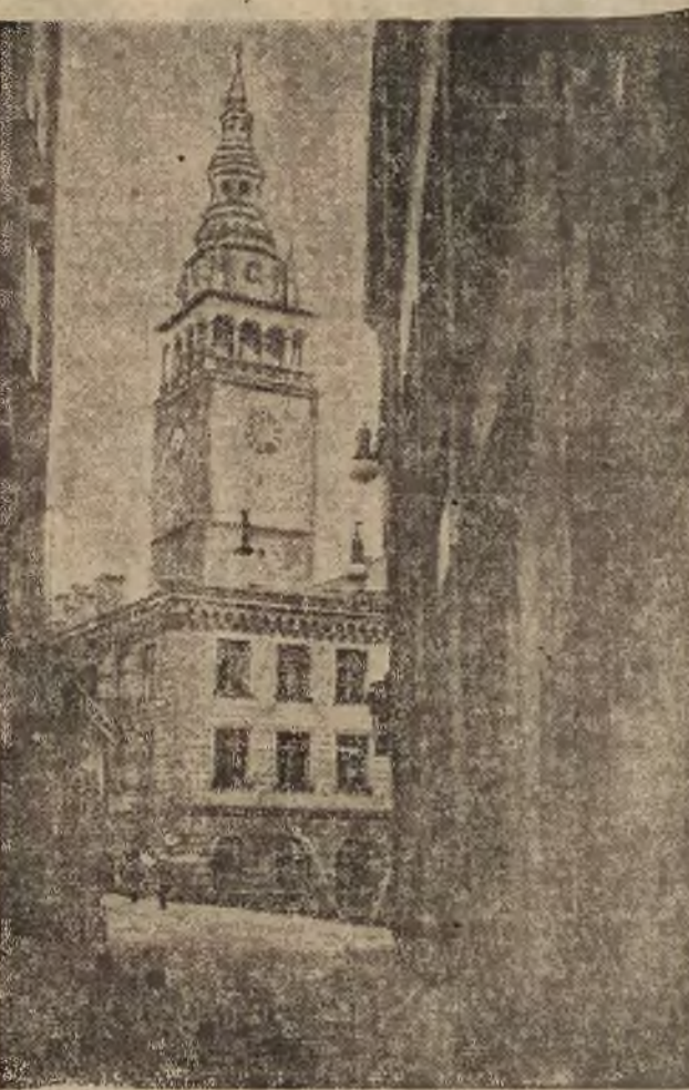
Kłodzko — piękny ratusz renesansowy