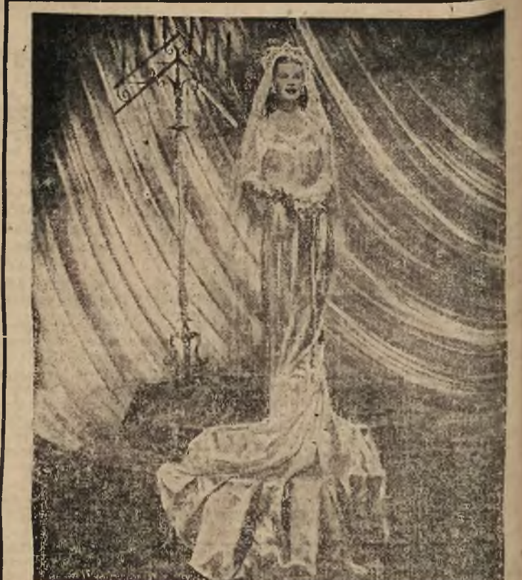
Ariene Dahl podpisuje kontrakt z najstarszą wytwórnią Warner Bros (First National Pictures).