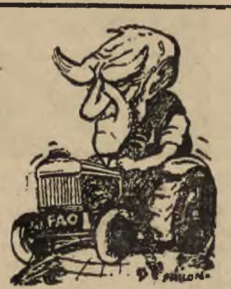
JOHN BOYD ORR Gen. dyr. FAO.

Amerykańscy farmerzy przeżywają teraz okres niebywałej „prosperity”. W tej sytuacji są oni za chętni do przetrzymywania psze-