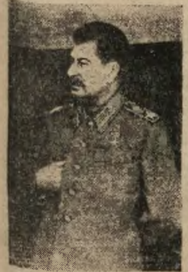
GENERALISSIMUS STALIN twórca zwycięstwa

MOSKWA, czwartek Naród radziecki obchodził w dniu wczorajszym dzień zwycięstwa nad Japonią. Dwa lata temu zwycięstwem nad Japonią została zakończona druga wojna światowa. Związek Radziecki, który ponosił główny ciężar walki z hitleryzmem, na tydzień po rozgromieniu faszystowskich Niemiec wziął udział w ofensywie przeciwko drugiemu imperializmowi — zagrożeń światu — imperializmowi japońskiemu. Przystąpienie Związku Radzieckiego do wojny przeciwko Japonii i rozgromienie armii kwantunskiej odegrało decydującą rolę w przyspieszeniu końca wojny.