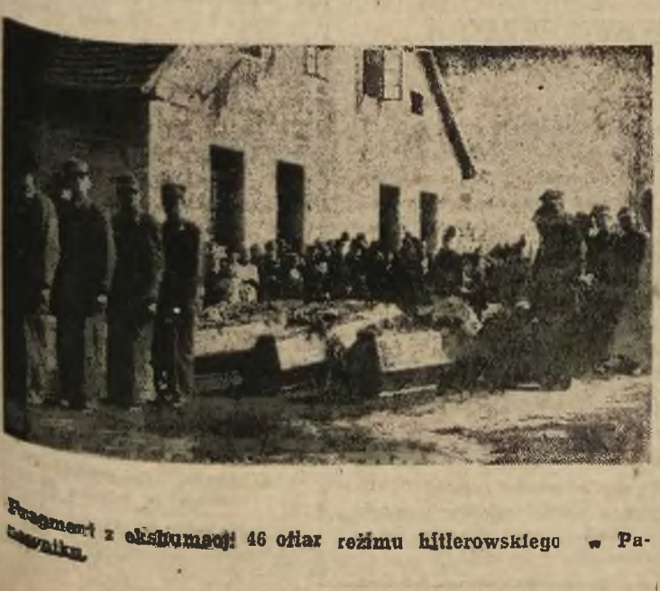
Fragment z ekspozycji 46 ołtarz reżimu hitlerowskiego w Pałacu

„NARÓD POLSKI SAM PRAKUJE NA SIEBIE I DLA SIEBIE, I DLATEGO PRAKUJE OFIARNIE. Wszystko zależy od ludzi, a zwłaszcza od kierownictwa. Na kierowniczych ludziach przemysłu ciąży nadal wielkie zadanie. Będziemy się od nich domagać systematycznego wypełniania planu produkcyjnego i to przede wszystkim będzie miernikiem ich osobistej wartości a nie legitymacja partyjna, takiej czy innej partii, jeśli ją posiadają. Ta partyjna legitymacja zobowiązuje do wyższej produkcji. Szanujemy również bezpartyjnych demokratów, i jeśli lepiej pracują od członków Partii, cenimy ich wyżej od tych z legitymacjami. NIE LEGITYMACJA PARTyjNA ŚWIADCZY O WARTOŚCI CZŁOWIEKA, ALE JEGO PRACA I CAŁOKSZTAŁT JEGO PRACY WINNIEN DECYDOWAĆ, CZY NALEŻY MU PRZYZNAC TAKĄ LEGITYMACJĘ Trudności są po to, by je przezwyciężać W ubiegłym okresie zrobiliśmy niemało i nauczyliśmy się wiele. Łatwo więc powinniśmy maszerować naprzód. Na zżenie wysiłku i wytchnienie jeszcze nie nadchodzi pora. Jeszcze zbyt dużo piętrzy się trudności, lecz nie wolno ich się lekkać. Należy kochać się zasadą, że trudności istnieją po to, aby je przezwyciężać. Tylko w walce z trudnościami bartują się ludzie i wyrastają kadry dzielnych budowniczych, wyrastają kadry dzielnych kierowników. Ludzie przemysłu, dyktorzy, inżynierowie, majstrowie i cała polska klasa robotnicza, świadoma celów, do których zdąża, jak dotychczas tak i nadal, na pewno będzie przodować narodowi polskiemu w jego marszu historycznym ku lepszej przyszłości.