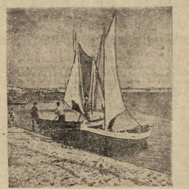
Przystojniawa piękna polska jesień pozwala na korzystanie z nadmorskich przyjemności. — Jastarnia.