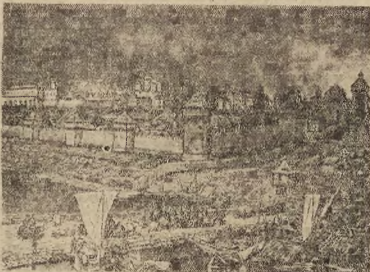
STARA I NOWA MOSKWA WIDOK NA KREML

W pamiętnym powstaniu grudniowym w 1905 roku, robotnicy moskiewscy dzień po dniu walczą: w bohatersko na barikadach, póki nie ulegli przemocy carskich wojsk i żandarmerii. Po raz drugi powstał robotniczy Moskwę z bronią w roku w listopadzie 1917 roku biorąc udział wraz z wojskiem w powstaniu przeciwko rządowi tymczasowemu Kiereńskiego. Zwycięstwo władzy radzieckiej otworzyło przed Moskwą nowe perspektywy rozwoju.