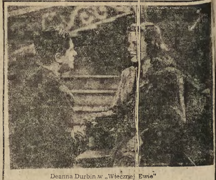
Deanna Durbin w „Wiecznej Ewie”