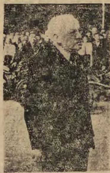
Minister Zdenek NEJEDLY przemawia

Podobne paczki przesłane zostały również ministrów: spraw zagranicznych — Masarykowi i sprawiedliwości — dr. Drlitnie i zawierały podobnie jak i poprzednia, trytol. Czechosłowackie władze bezpieczeństwa prowadzą gorączkowe śledztwo w celu ustalenia nazwisk zamachowców. „Wiadomość o usiłowanym zamachu na członków rządu czechosłowackiego wywalała w Pradze i całej Czechosłowacji wielkie wrażenie. Jak stwierdza dziennik tutejszy, „Rude Pravo” chodzi tu prawdopodobnie o czyn zywiołów antypaństwowych, które usiłują wprowadzić ferment w Czechosłowacji za pomocą zbrodniczych zamachów.