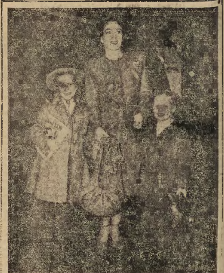
Znana nam dobrze z serii doskonałych filmów, „wyświetlanych na naszych ekranach Joan Crawford wraca ze swymi dziećmi z wczasów spędzonych w Rio de Janeiro.