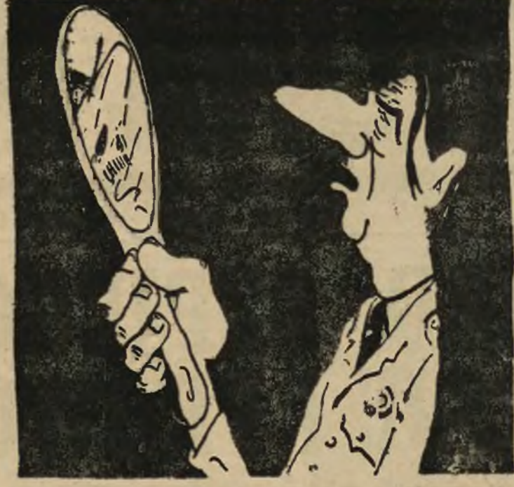
„Francji potrzeba wodza. Widzę tylko jednego kandydata na to stanowisko”. (Z ostatniego przemówienia gen. de Gaulle)