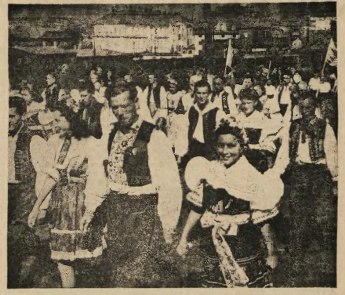
Grupy Czechów w strojach ludowych podczas pochodu