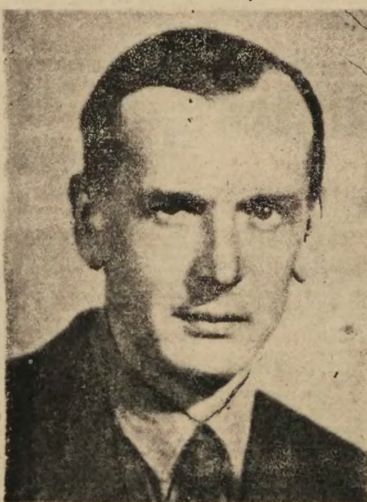
Jan Šverma, sekretarz CK KPC, zmarł w czasie powstania na Słowacji 7-go listopada 1944 roku.

Za łapówkę słowa przejść do was chciałem przez cienie Kłmnowym piśmem gałęzi zima piśala oredzie. I zgawroniałe smutkiem rymy ciężko pomknęły za martwymi Puzony sądu brzmijcie, szalbiertwo mandolin milcz zawrotność mroku! mnie gniecie rozdartej ziemi głąb. Pod jakim sztandarem się bić Wolności wicher nie chce wolności wicher nie chce żadnego już rozwichrzyć. A wszystkie moje słowa ten wiatr ścigają moje beznadziejne słowa ze skrzydłami nadziei. Gdy wiersz obejrzał się co wiersz zobaczył wiersz mój, ta żona Lota że oniemiał skamieniał milczeniem się omołał. Co wiersz zobaczył? Zastępy sprawiedliwych których Bóg nie słyszał („Torso nadeję”)