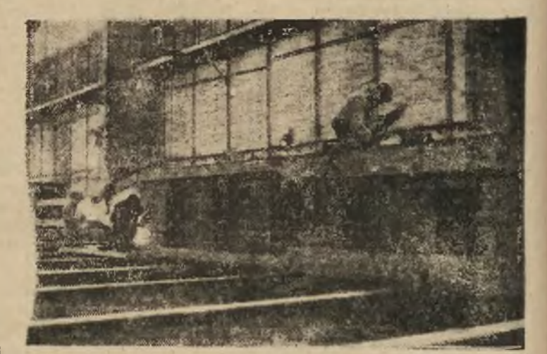
Montowanie przęsła mostowego w hucie „Łabedy”