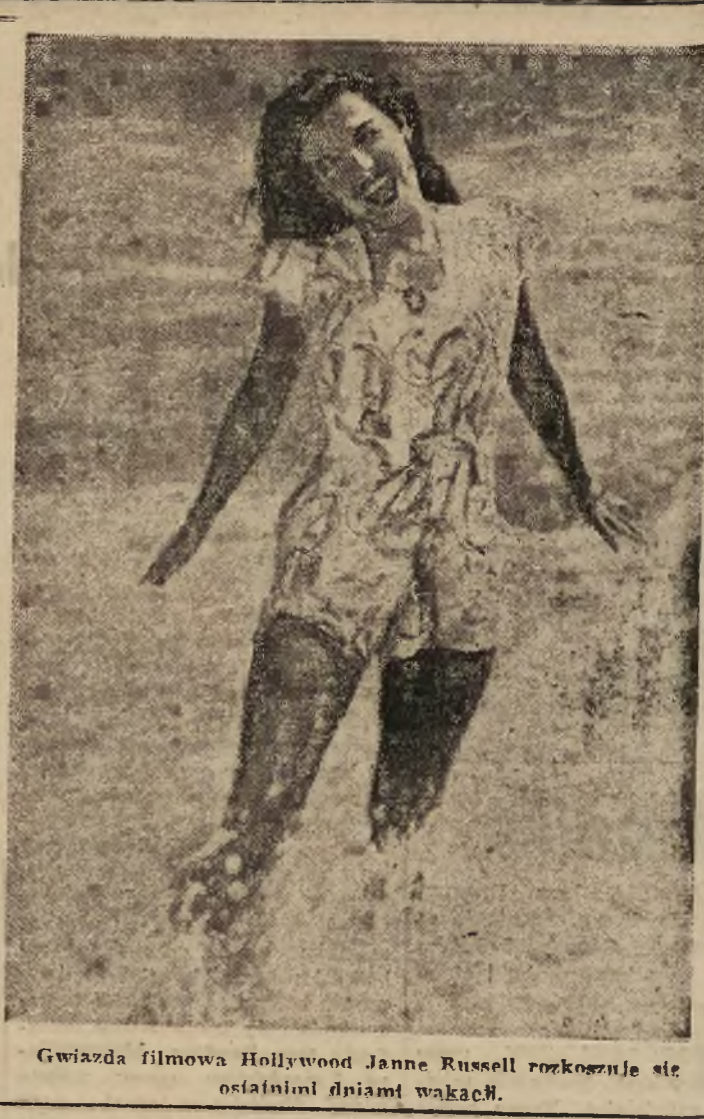
Gwiazda filmowa Hollywood Janne Russell rozkoszuje się ostatnimi dniami wakacji.

(1452-1519) był uczniem Verrocchio, znakomitego rzeźbiarza i malarza florenckiego.