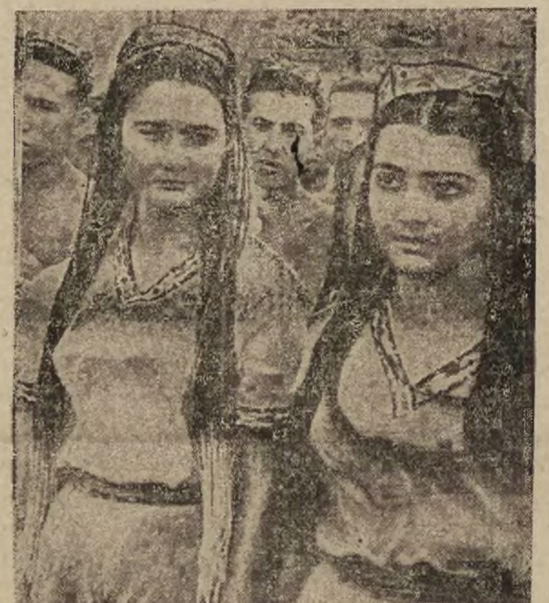
Przepletne stroje ludowe posiadają dziewczęta zamieszkujące republiki w Środkowej Azji.