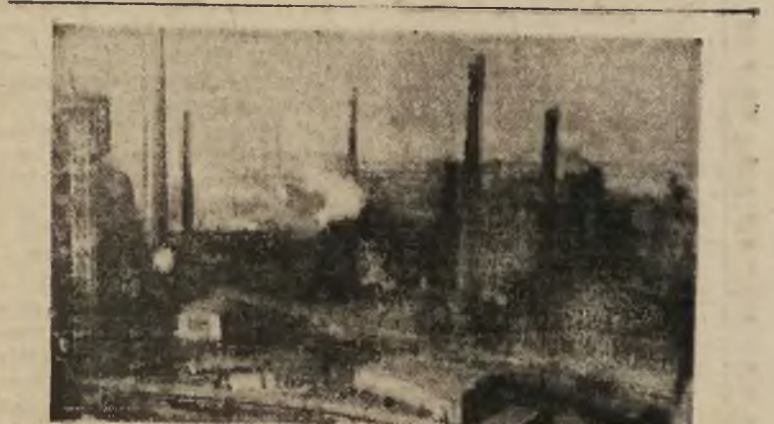
Nowe kadry absolwentów Politechniki w Gliwicach przyczynią się w przyszłości do wzmocnienia produkcji polskich hut, fabryk i kopalń