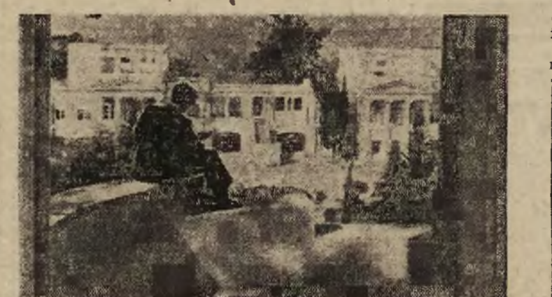
Nad brzegiem Czarnego Morza leży najpiękniejsze uzdrowisko Związku Radzieckiego — Sochi. Na zdjęciu sanatorium wypoczynkowe wydawnictwa „Prawdy”