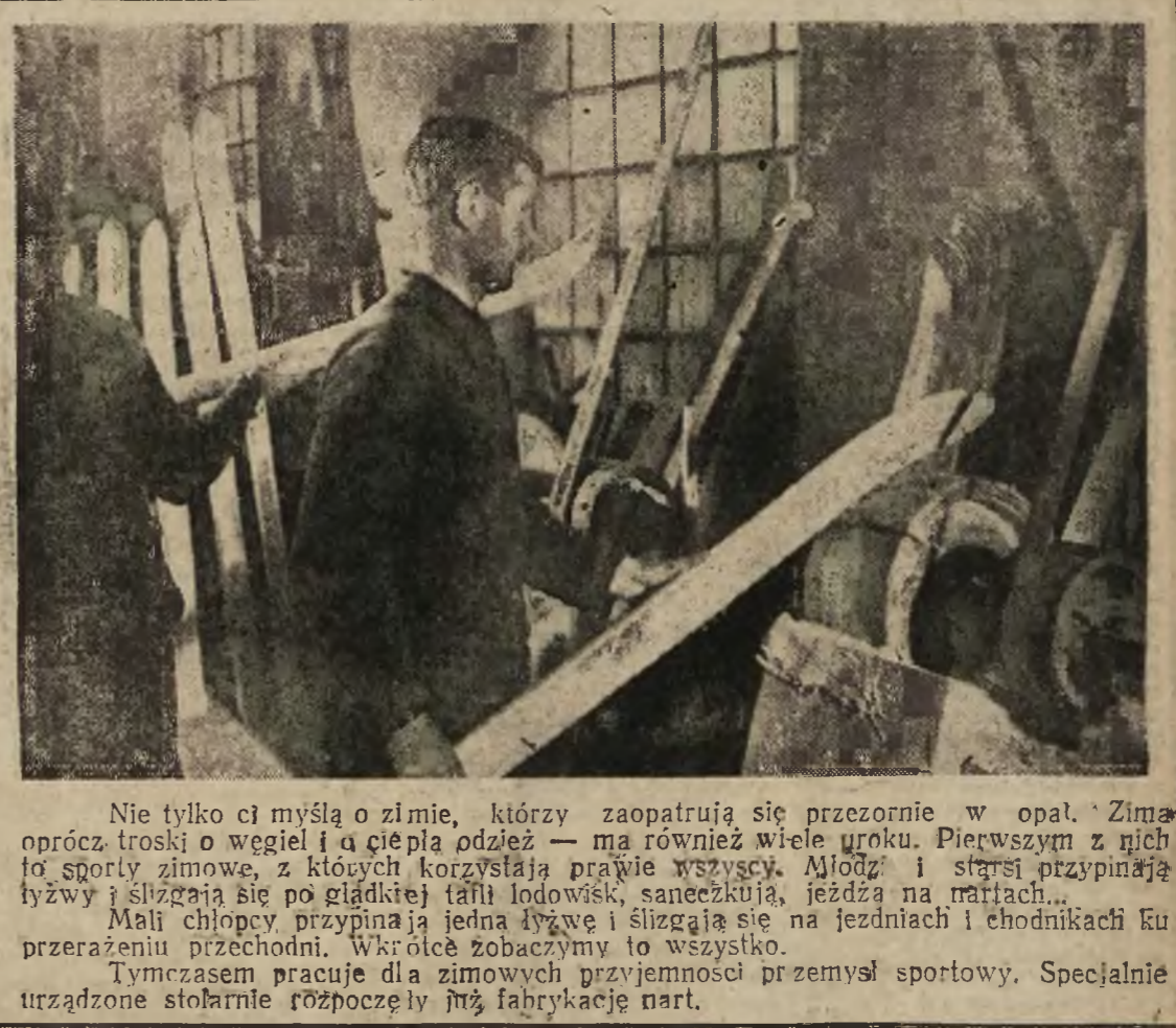
Nie tylko ci myślą o zimie, którzy zaopatrują się przezornie w opał. Zimą oprócz troski o węgiel i ciepłą odzież — ma również wiele uroku. Pierwszym z nich to sporty zimowe, z których korzystają prawie wszyscy. Młodzież i starsi przypinają żywy i ślizgają się po gładkiej tafli lodowisk, saneczki, jeżdżą na narciach... Młodzi chłopcy przypinają jedną łyżwę i ślizgają się na jezdniach i chodnikach. Kuchnia i chłodnia... Tymczasem pracuje dla zimowych przyjemności przemysł sportowy. Specjalnie urządzone stołarnie rozpoczynają już fabrykację nart.

NOWY JORK, piątek. Wczoraj w Waszyngtonie prezydent Truman Zjednoczonych OBIECUJE POMOC... ale... nie chce zwołać sesji Kongresu. Według danych oficjalnego sprawozdania UNRRA dotyczące odbudowy przemysłu w Polsce, ogłoszonego w marcu br., produkcja węgla w Polsce w roku 1946 osiągnęła 47,3 milionów ton, czyli około 70 procent produkcji przedwojennej. Poziom ten został osiągnięty dzięki nadzwyczajnym wysiłkom w dziele przyspieszenia odbudowy. Według planów oficjalnych, przewidyujących import koniecznych urządzeń z zagranicy, produkcja miała osiągnąć 60 milionów ton w roku 1947 (poziom mniej więcej równający się produkcji sprzed wojny), 70 milionów ton w roku 1948, 80 milionów ton w 1949 r., czyli o 20 proc. więcej, niż wynosiła produkcja w roku 1937.