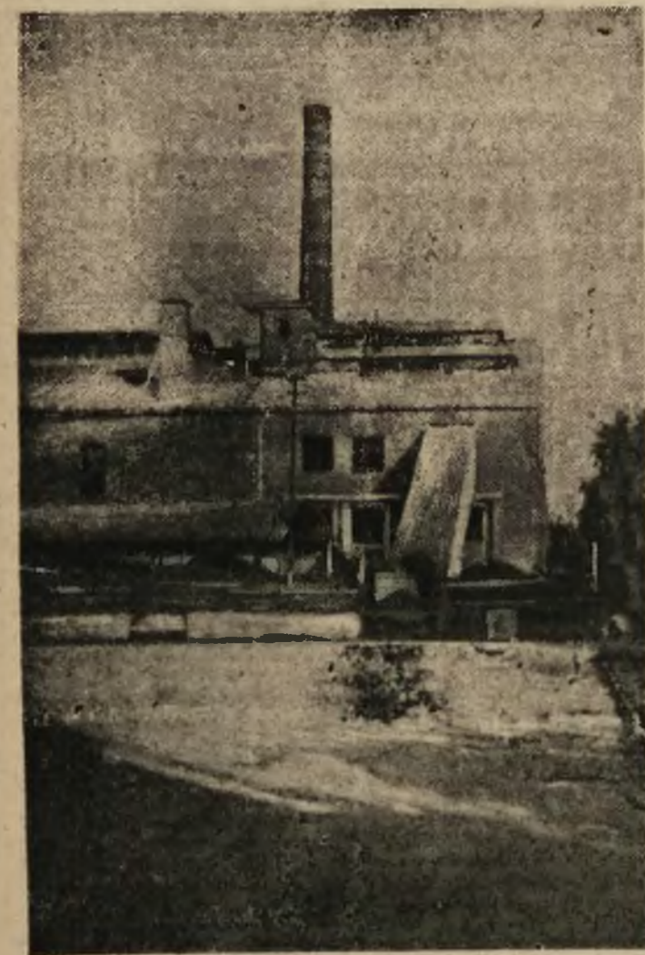
Huta szkła „Janina” w Murowie koło Opola