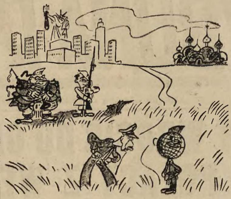
GENERAL MARSHALL: Na prawo patrz! Hergot, nie wiecie gdzie macie prawa rękę?