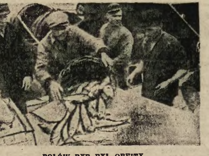
POŁÓW RYB BYŁ OBFIITY..

Od 1 listopada r. b. trzy państwa we fabryki na Ziemiach Odzyskanych rozpoczynają pełną produkcję domków typu fińskiego.