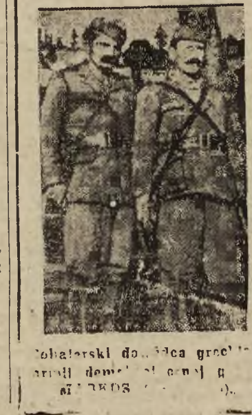
Bohaterki dołża greckiej armii...