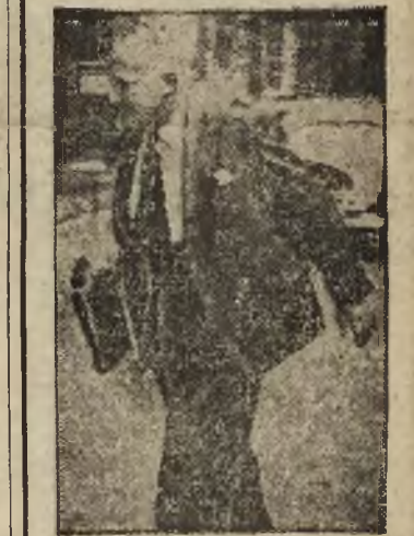
Na zdjęciu min. Shinwell opuszcza gmach rady ministrów po wykluczeniu go ze ścisłego udziału.