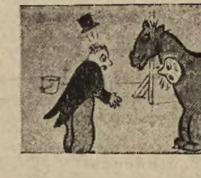
Pańko dyrektorze! Prędko wody! Aniek zamidlał