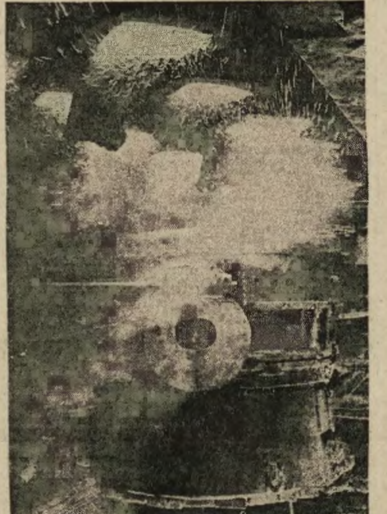
Metalurgiczny zakład stalingradzki 'Czerwony Październik'...

dających fazom księżyca. Nie jest wprawdzie wykluczone, że nie-