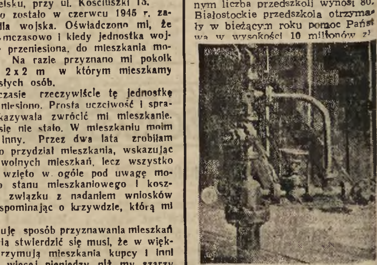
Ujęcie gazu w „głowicę-separator” na szybie Simeradz L.

BIAŁYSTOK ROZWÓJ PRZEDSZKOLI W roku ubiegłym na terenie woj. białostockiego istniało 67 przedszkoli, w których zatrudnionych było 180 przedszkolank. W porównaniu z okresem przedwojennym liczba przedszkoli wzrosła trzykrotnie. W nowym roku szkolnym liczba przedszkoli wynosiła 80. Białostockie przedszkola otrzymały w bieżącym roku pomoc Państwa w wysokości 10 milionów zł.