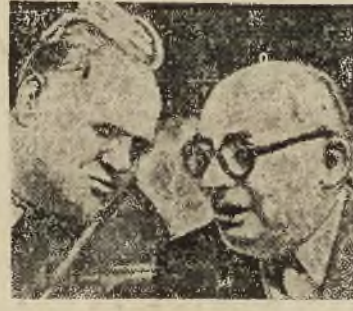
Maurice Thorez w rozmowie z tow. J. Duclos