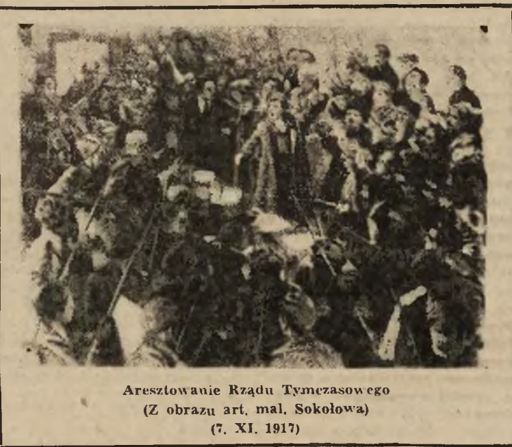
Aresztowanie Rządu Tymczasowego (Z obrazu art. mal. Sokolowa) (7. XI. 1917)

Demonstracja 1 lipca w PETERSBURGU nad grobem ofiar Rewolucji, stała się prawdziwym triumfem Bolszewickiej Partii, 400.000 DEMONSTRANTÓW szło pod hasłami: „Precz z 10 ministrami — kapitalistami”. „Precz z wojną”. „Cała władza w ręce Rad”. Była to kompletna klęska burżuazji i jej pomocników.