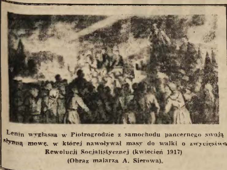
Lenin wręcza w Piotrogradzie z samochodu pancernego swoją słynną mowę, w której nawoływał masy do walki o zwycięstwo Rewolucji Socjalistycznej (kwiecień 1917) (Obraz malarza A. Sierowa).

WIELKA, SOCJALISTYCZNA REWOLUCJA LISTOPADOWA ZWYCIĘŻYŁA. Po raz pierwszy w historii ludzkości powstał RZĄD ROBOTNIKÓW I CHŁOPÓW, który na jednej szóstej części świata postanowił stworzyć ustrój bez wyzysku klasowego, ustrój bez panów i chłopów. Po raz pierwszy triumfowały CZERWONE SZTANDARY oblane obficie krwią robotniczą, triumfowały ku radości wszystkich pracujących świata, ku przerażeniu i grozie wszystkich sił ciemności, reakcji i wyzysku.