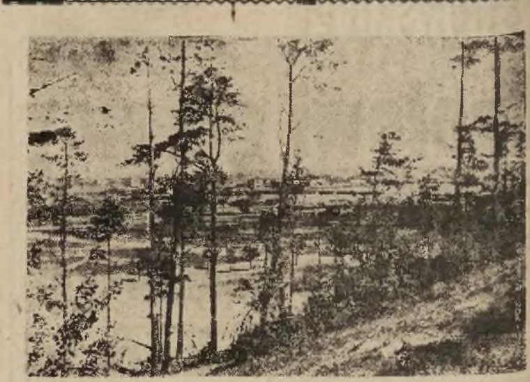
WIDOK NA GDYNIE