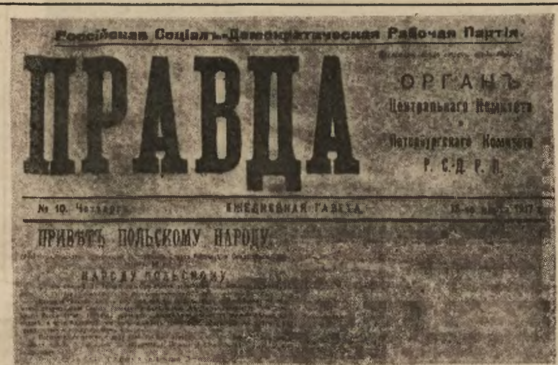
Centralny organ partii bolszewickiej „Prawda” z dnia 16 marca 1917 r. z tekstem oredzia „Do Narodu Polskiego” na stronie tytułowej.

NOWY RZĄD NIE O WIELE RÓŻNIŁ SIĘ OD STAREGO. Wojna trwała dalej. Speku-