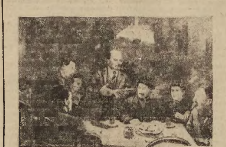
Lenin na posiedzeniu Wojenno - Rewolucyjnego Komitetu. (7. XI. 1917)

NARÓD pragnął ziemi dla chłopów i wolności dla ludów ujarzmionych. Tymczasem w