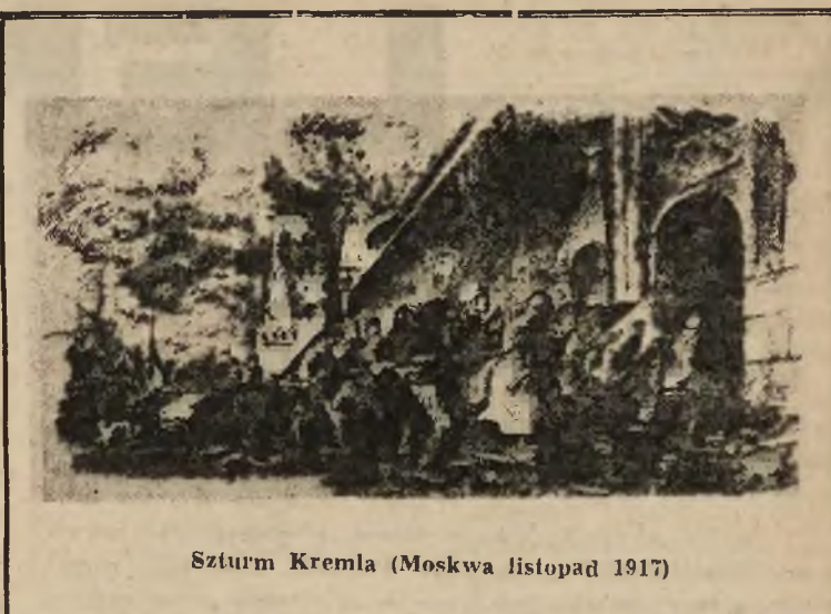
Szturm Kremla (Moskwa listopad 1917)

która stanęła na czele demonstracji, utrzymała ona pokój i zorganizowany charakter. Rząd zaś wysłał przeciw demonstrantom oficerów i junkrów, zalał ulice stolicy krwią robotników i żołnierzy. Upojęny swoim „zwycięstwem” nad własnym narodem po klęsce na froncie rząd przeszedł do pogromu PARTII BOLSZEWICKIEJ. Rozgromiono lokale partyjne, rozbito drukarnie, aresztowano wielu wybitnych działaczy, oskarżono Lenina o zdradę stanu.