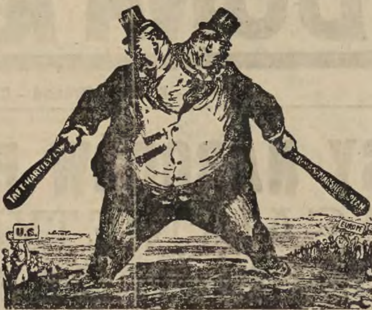
Ameryce — Ustawa Taft — Hartley, Europie — Plan Truman — Marshall.