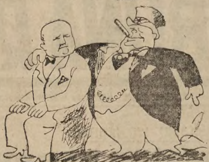
Coż z tego, że cię pozbawiono obywatelstwa, jesteście przeciw honorowym obywatelom podziemia...