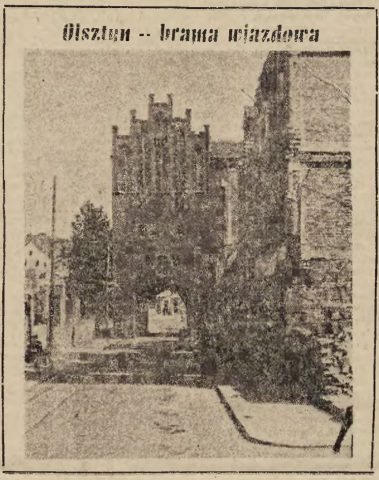
Olsztyn — brama wjazdowa