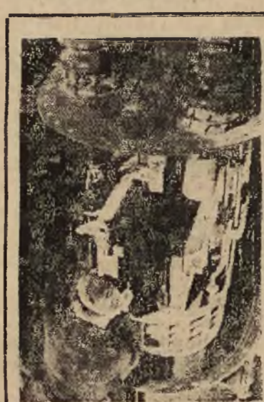
Odbudowujący się przemysł elektryfikacja miast i wsi, budowa nowych elektrowni i linii wysokiego napięcia, prace kopalń i nowych portów nad Bałtykiem — stworzyły ogromne zapotrzebowanie na wyroby elektrotechniczne które w coraz większym stopniu są zapakajane przez przemysł krajowy którego szybki rozwój daje duże możliwości eksportowe

W zakończeniu wytyczne wskazują na konieczność dalszej rozbudowy szkolnictwa wszelkich typów na wsi, na rolę uniwersytetów ludowych oraz organizacji Wiej i Przesosobienia Rolniczo-Wojakowskiego w szeregach kultury na wsi.