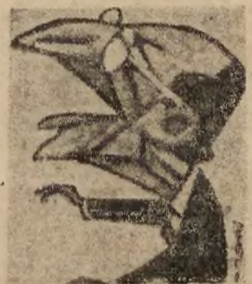
Premier DE GASPERI amerykański „gauleiter” Włoch

Rzym, piątek. Rzymskie związki zawodowe ogłosiły strajk generalny na znak protestu przeciwko odrzuceniu przez rząd postulatów włoskiej klasy robotniczej w sprawie wypłacenia świadczeń premii gotówkowych oraz zatrudnienia bezrobotnych przy pracach użyteczności publicznej.