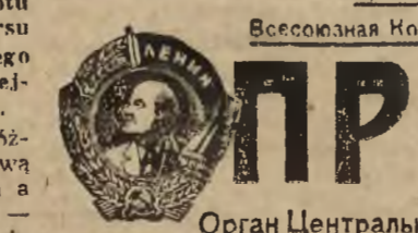
Орган Центрального Комитета и МК ВКП(б).

LONDYN, wtorek Jak donosi agencja Reutersa parlament irański 72 głosami przeciwko 34 postanowił wyznaczyć na miejsce premiera Gham es Sultaneh, który w ubiegłym tygodniu nie uzyskał wotum zaufania i podał się do dymisji, obecnego przewodniczącego parlamentu — Sardar Fakher Hekmata. Nominacja Hekmata wymaga zatwierdzenia ze strony szacha.