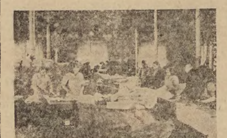
Przegład i pakowanie półtwa