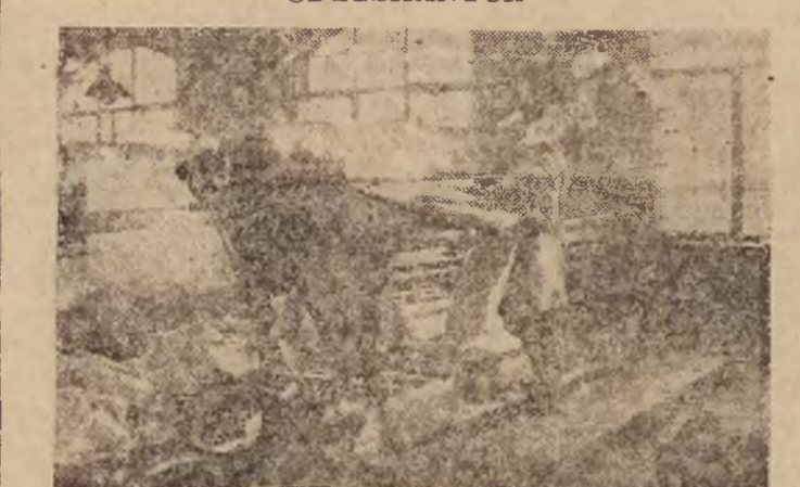
Stoły do przegładania półtwa — wymywanie i obcinanie zerwanych nitok