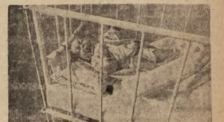
Czyste i piękne urządzenie zlokalizowane w Warszawie, ufundowane przez Sztokholm

W CELU OTOCZENIA NA LEŻYTA OPIEKĄ AKCJI WSPÓŁZAWODNICZWA I JEGO UCZESTNIKÓW.