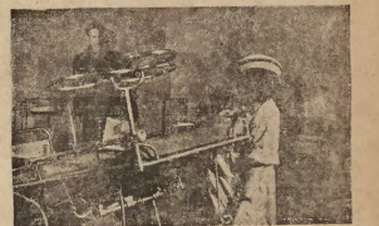
Urządzenia szpitala położniczo - ginekologicznego na Czysym w Warszawie, ufundowane przez Sztokholm