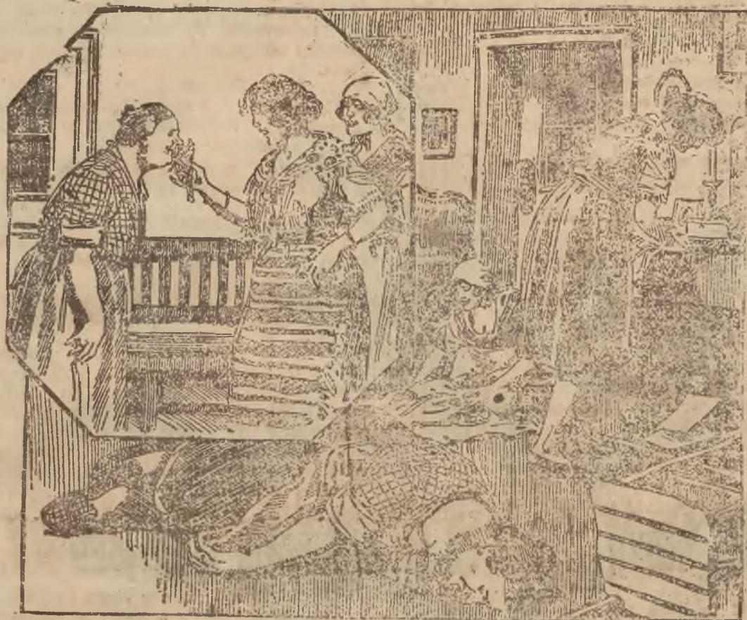
(Objaśnienie wewnątrz numeru).