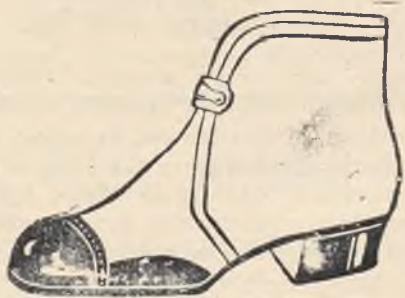
Mod. 4061, nr. 23—26

Skorzystajcie ze sposobności i kupcie dla dzieci dobre, ciepłe obuwie, które uchroni je przed zaziębieniem.