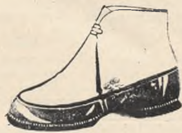
Mod. 522, nr. 27—30