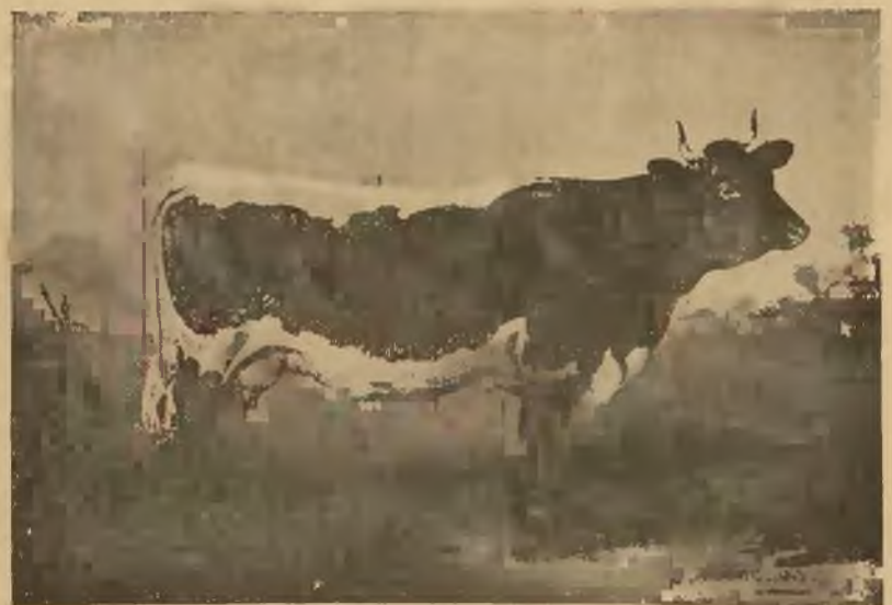
Krowa rasy pingawsko-meltalskiej.