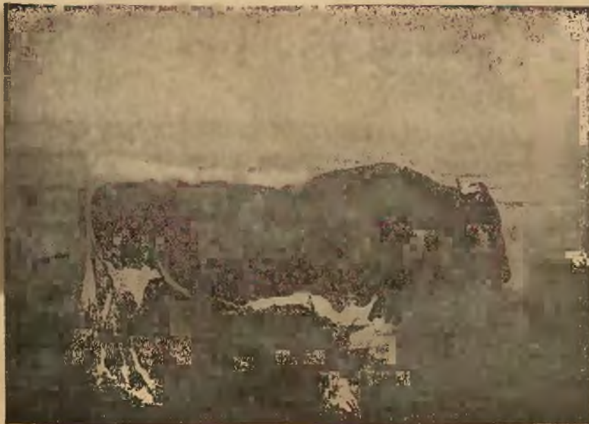
Stadnik rasy pingawsko-meltalskiej.

Zaletami bydła węgierskiego są zadowalanie się byle jaką paszą, wytrzymałość i wytrwałość w pracy, zaś ujemnymi stronami są powolny wzrost i słaba mleczność.