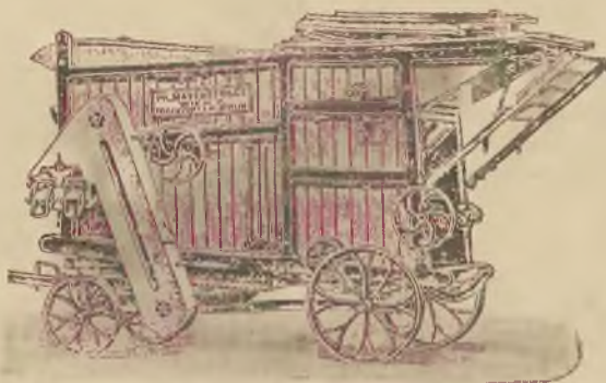
Uzuane za najcelniejsze

ces. i król. dostawca Dworu w Jarosławiu. 36